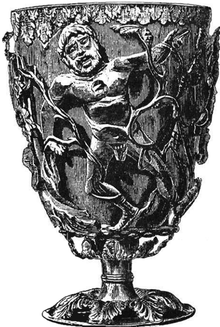
Fig. 2. — Vase de verre avec monture d'argent, d'après une ancienne gravure.

à reliefs représentant le délire de Lycurgue dans les vignes, appartenant à la collection du baron Lionel de Rothschild, alors membre du Parlement britannique 1 . Il est reproduit dans un long article illustré de William Chaffers, intitulé : Glass, its manufacture and examples . Les gravures sont presque toutes empruntées à la collection de Felix Slade, dont il existe un