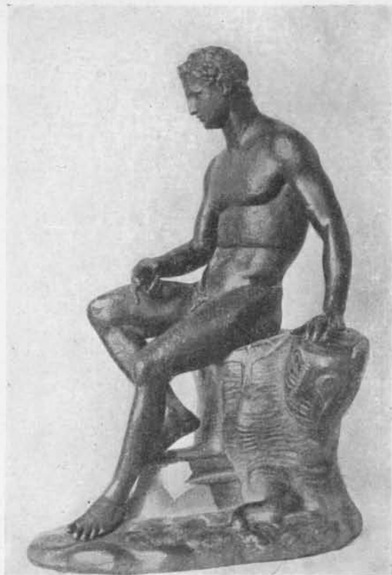
Fig. 2 Hercule de Feurs. Bronze de la Collection Loeb à Munich.