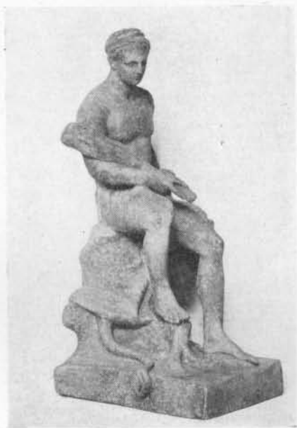
Fig. 3. — Hercule de Feurs. Moulage du Musée de l'Université de Leipzig.