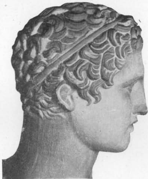
Fig. 4 Tête d'Hercule de la Collection Lansdowne.

guère qu'une bonne copie, celle de Feurs, qui tire de là une importance considérable, justifiée d'ailleurs par sa beauté exceptionnelle 1 . De l'Hermès assis, nous avons un grand exemplaire de bronze à Naples, trouvé à Herculanium, un autre en pierre trouvé à Mérida, un bas-relief de Horn avec la dédicace