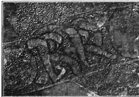
FIG. 5. MONOGRAMME FIGURÉ SUR L'ÉTOLE D'UN DES ANGES DU « MARTYRE DE SAINT DENIS ».