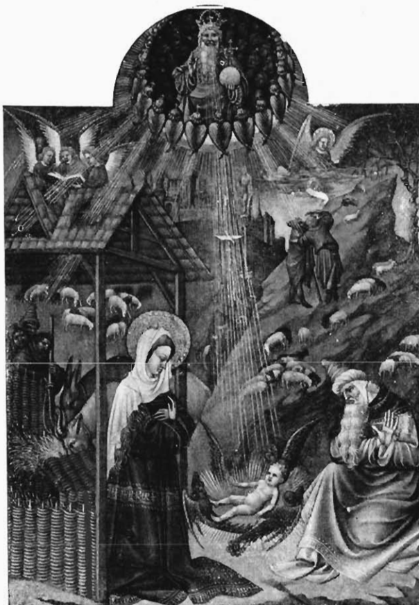
FIG. 4. — LA NATIVITÉ. Miniature des Très riches Heures du duc de Berry , présentant les monogrammes HB, HR.

Quand je les ai étudiés à Chantilly, l'un d'eux surtout m'a tout de suite frappé : c'est une sorte de strygilles — car il m'a fallu donner des noms à ces formes bizarres, pour me reconnaître dans mes fiches, — qui, entremêlés avec d'autres signes incompréhensibles, servent à séparer alors deux autres signes, toujours identiques, toujours les mêmes, qui reviennent à intervalles à peu près réguliers dans toutes — je dis dans toutes — les inscriptions. Il n'y a pas une des miniatures de cette série où ils ne soient absolument visibles, mis en très évidente lumière.