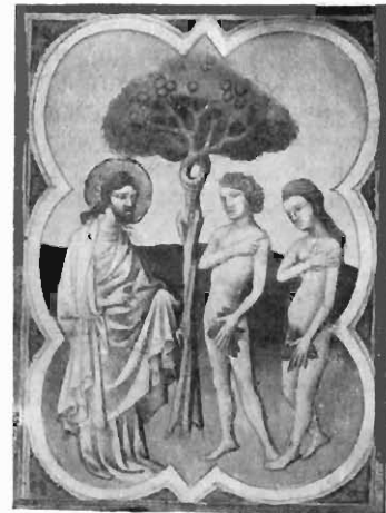
FIG. 2. DIEU INTERROGEANT ADAM ET ÈVE. Miniature du ms. fr. 166 de la Bibliothèque nationale.

Il est assurément des compositions qui peuvent en être rapprochées, mais je ne connais, dans aucune école, à aucune époque, rien qui leur soit supérieur. Il n'y a pas là une question de chauvinisme, mais une question d'art pur ; aucun artiste n'a traité avec une maîtrise plus idéale le Christ au Jardin des Oliviers ; les deux personnages du Zodiaque sont l'œuvre d'un peintre merveilleux. Il n'est pas d'artiste enfin qui ait montré plus de finesse humoristique que celui du Paradis terrestre (fig. 3). Est-il rien de plus spirituel, en effet, que cette jeune fille tentée, que cette jeune séductrice qui