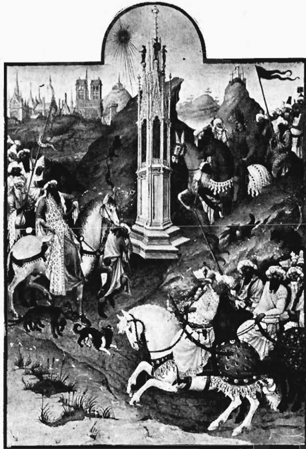
FIG. 8. — L'ARRIVÉE DES ROIS MAGES.

En effet, Malouel, qui entre officiellement au service du duc de