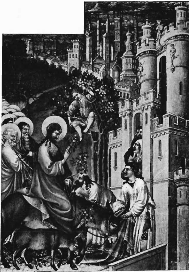
FIG. 6. — L'ENTRÉE DE JÉSUS A JÉRUSALEM. Miniature des Très riches Heures du duc de Berry .

Impossible, ici de photographier ; je n'ai pu que copier servilement l'inscription. Mais, en présence des deux autres photographies, l'illusion ne saurait être admise, puisque ce n'est, en réalité que la répétition des signes que la plaque photographique a mathématiquement enregistrés.