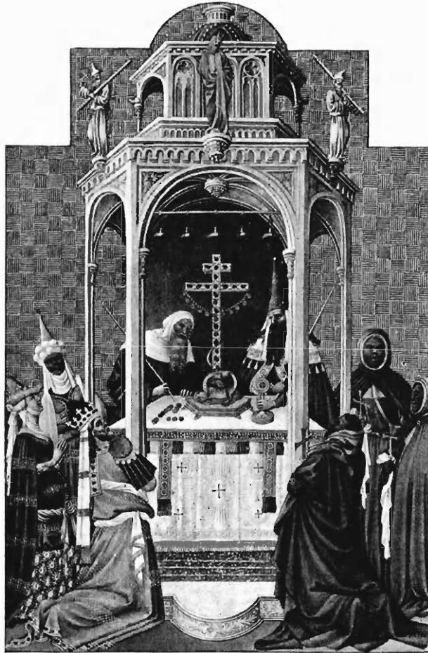
FIG. 9. — L'ADORATION DE LA CROIX.

demeura donc à Dijon à partir de cette date, certainement sans esprit de retour. Il est par conséquent naturel que les feuilles des cahiers, déjà