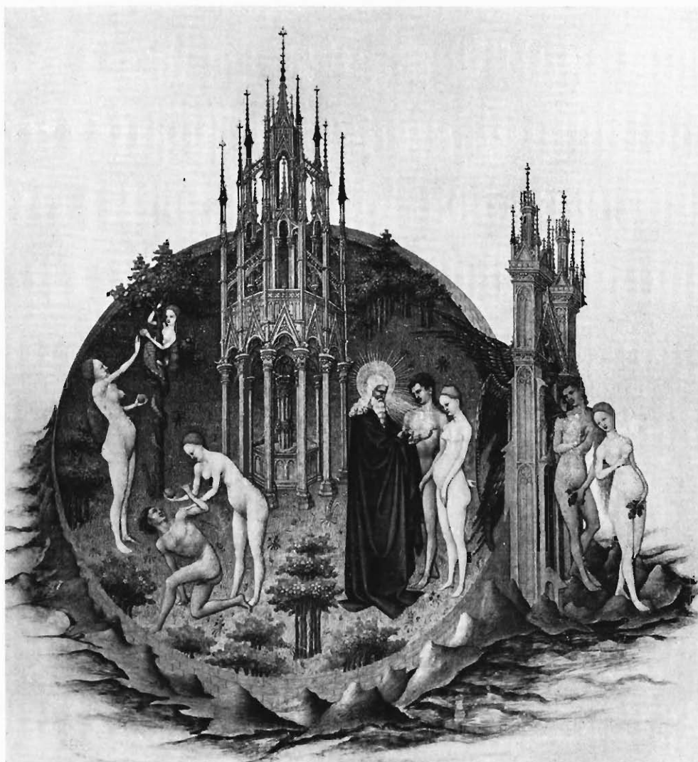
FIG. 3. — LE PARADIS TERRESTRE. Miniature des Très riches Heures du duc de Berry .

en quelque sorte, Botticelli et Courbet. D'ailleurs, pour préciser, nous