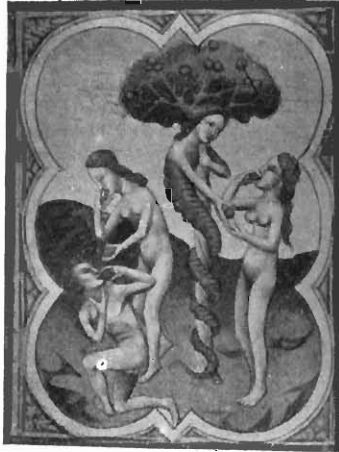
FIG. 1. LE PÉCHÉ ORIGINAL. Miniature du ms. fr. 166 de la Bibliothèque nationale.

terrestre, le Christ au Jardin des Oliviers . Elles doivent certainement être mises au rang des plus admirables chefs-d'œuvre de la peinture.