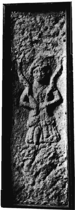
Fig. 3. — Stèle d'Ilkley.

Une étape de plus et nous arrivons au Jupiter de Vaison, équipé en général romain malgré sa roue et son serpent. L'autre petit bronze reproduit de profil appartient à la même série ; mais il semble qu'il n'ait tenu qu'un