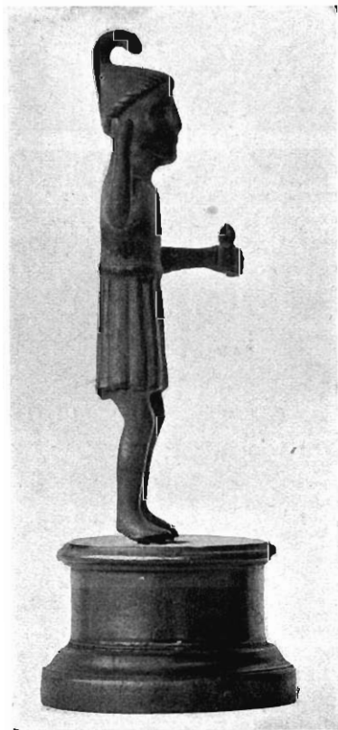
Fig. 5. — Bronze du British Museum.

Dans les mêmes régions danubiennes d'où provient sans doute cet ex-voto, le dieu au serpent paraît avoir été également assimilé à Mars : il se dresse devant ce dieu sur une plaque de bronze de Traismauer et il s'enroule autour de la lance du Mars d'un relief en bronze de Szamos-Ujvar (au N.-O. de la Dacie). Il est vrai