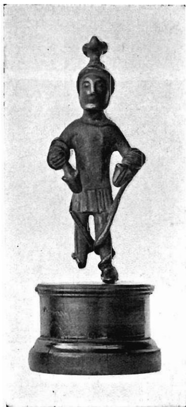
Fig. 4. — Bronze du British Museum.

accroupi, regardant le dieu qui tient le serpent ; c'est également vers lui que le Mercure semble s'avancer. La bourse que tient ce Mercure suffit à faire voir en lui le dieu gaulois romanisé ; on peut donc reconnaître dans son compagnon le dieu au serpent assimilé à l'Esculape gréco-romain.