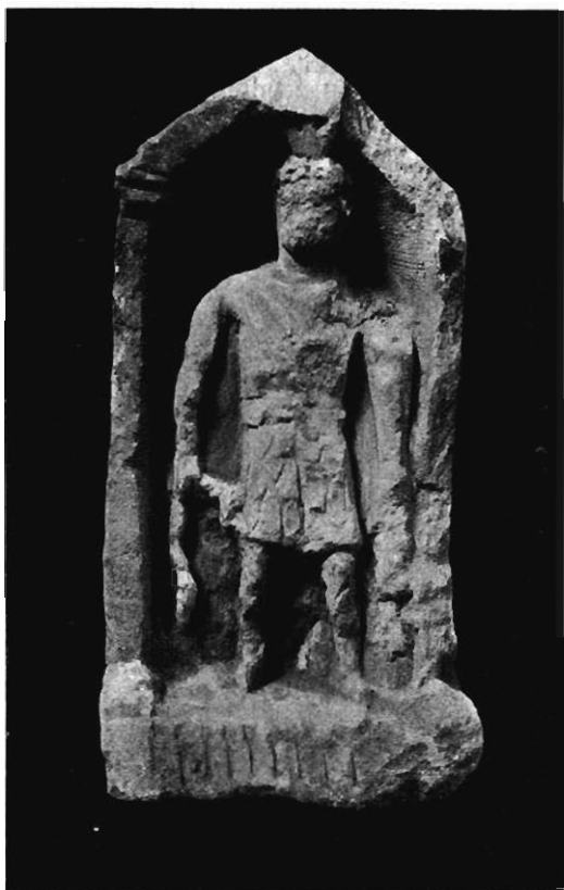
Fig. 1. — Stèle de Vignory.

du 1 er siècle, mais aucun monument ne fait connaître l'emploi d'une jupe imbriquée dans l'armée romaine. C'est sur un vêtement entièrement collant que sont fixées les écailles dans l'uniforme que les cataphractaires romains empruntèrent, au