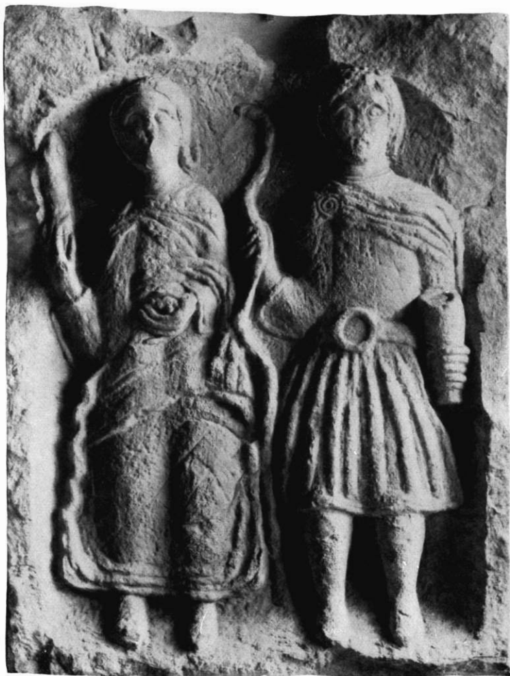
STÈLE GALLO-ROMAINE. — Musée de Nancy.