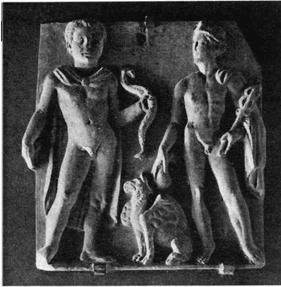
Fig. 6. — Stèle de Venise.

que, dans ces régions, on peut toujours se demander si le dieu romanisé n'est pas d'origine dacique plutôt que celtique. Les fameuses enseignes des Daces, faites d'un dragon fixé au bout d'une perche, suffisent à attester que le serpent était sacré chez eux 1 . Les Gaulois firent-ils un emploi semblable du serpent? On a depuis longtemps remarqué que leur trompette nationale,