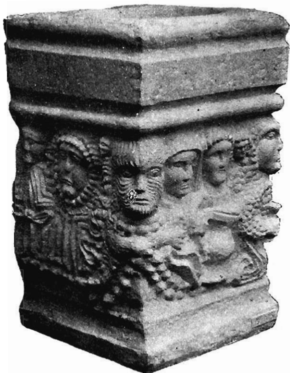
Fig. 2. — Autel de Virecourt.

autre triade, formée d'un dieu tricéphale, d'une déesse drapée à patère et d'un dieu à demi-nu à corne d'abondance et à patère, le serpent se dresse entre le dieu et la déesse, comme s'il cherchait à atteindre la patère du dieu 1 . Sur la face centrale de l'autel de Virecourt (Meurthe-et-Moselle) où deux déesses sont