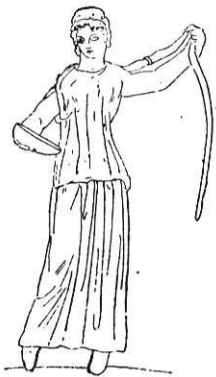
Fig. 8. — Bronze de la collection Torlonia.

Nous avons donc en Italie la figuration d'une déesse aux serpents qui rentre dans le même groupe que celles de Knossos, de Lykosoura et de Mavilly et il devient par là plus vraisemblable que Diane put être représentée de même à Rome 1 . On sait, d'ailleurs, que sa statue la plus réputée dans le Latium était celle d'Aricie. Oreste l'y aurait apportée de la Chersonnèse Taurique et c'est à Rhégion qu'il aurait débarqué avec elle en Italie 2 . Or, l'Artémis tauropolos avait tous les caractères de