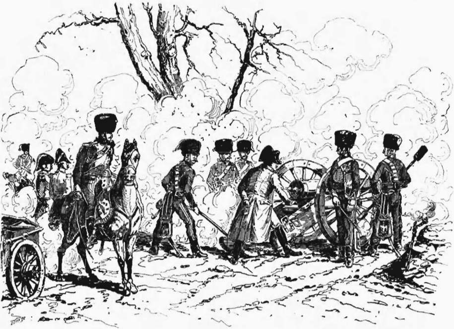
Napoléon à Montereau, dessin de DICK DE LONLAY.

Dans son nouveau livre, qu'il a intitulé : Nos Gloires militaires , il a raconté, comme l'indique le titre, les faits d'armes les plus célèbres dont se glorifie notre histoire nationale, les actes de bravoure les plus fameux que les armées fran-