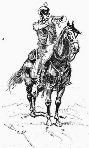
Trompette de chasseurs à cheval, dessin de DICK DE LONLAY.

Nos Gloires militaires ; texte et dessins par DICK DE LONLAY; Tours, Mame.