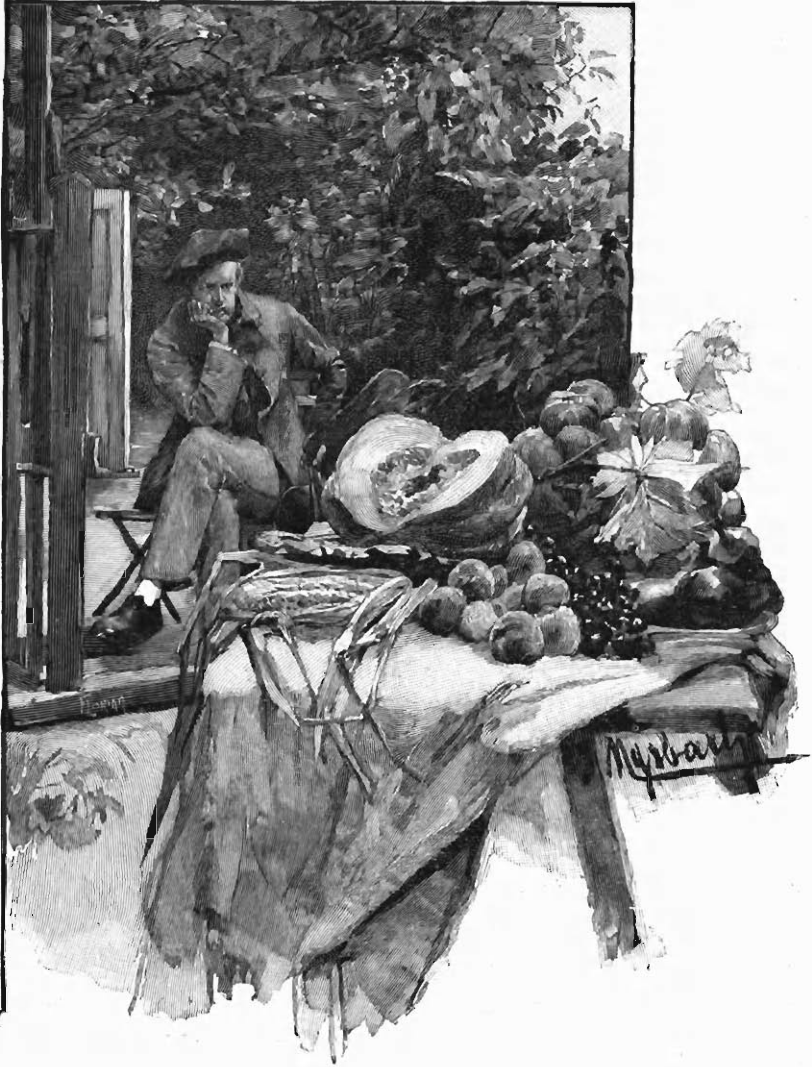
Le Démon de la nature morte, dessin de MYRBACH Contes de Paris et de Provence

une vérité d'observation trop rare chez les dessinateurs qui s'adonnent à l'illustration des livres. Les plus importantes de ces compositions ont été gravées