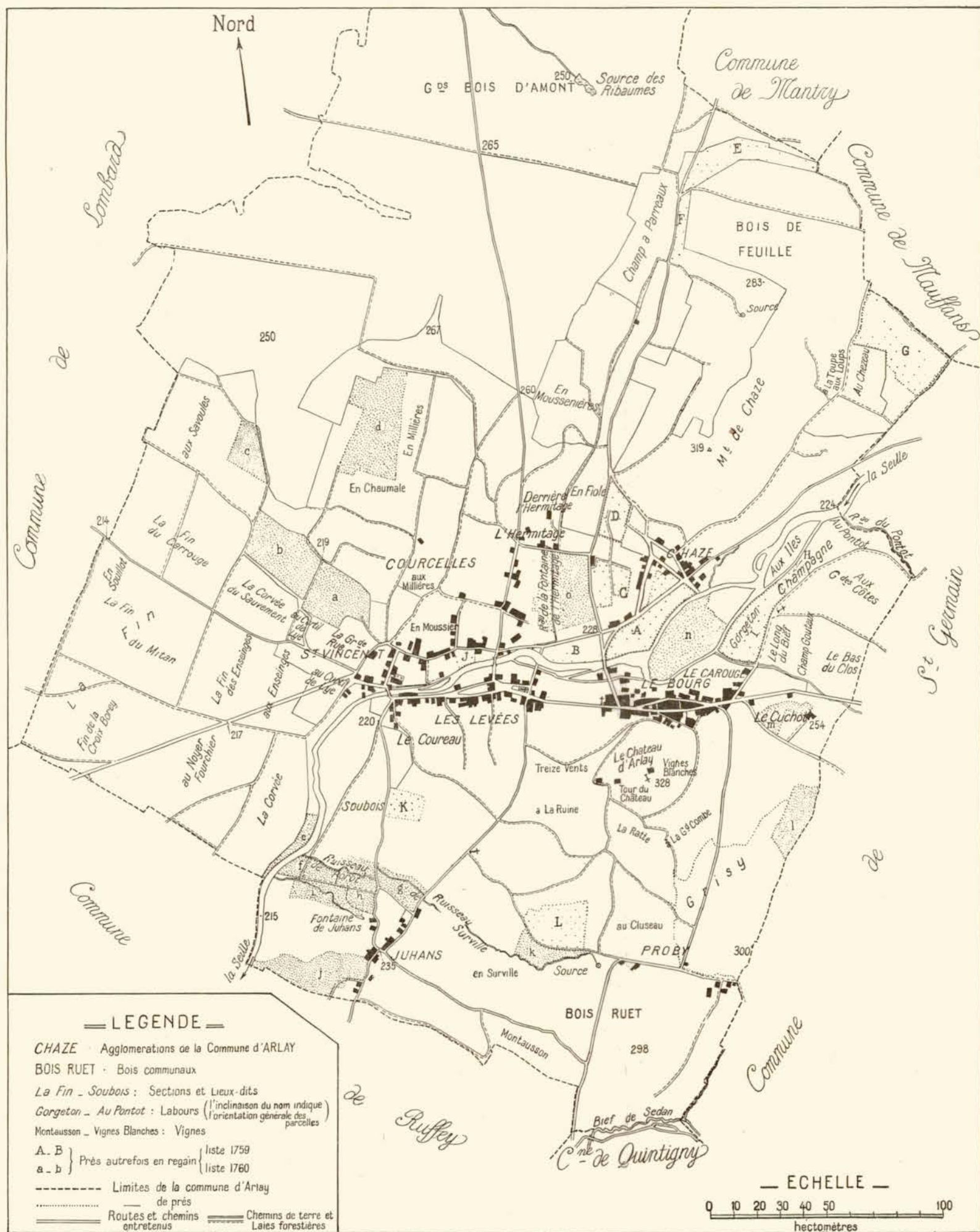
FIG. 3. — Prés, labours et vignes d'Arlay.

Les différents réseaux de chemins ruraux caractérisent assez bien les éléments essentiels du terroir d'Arlay.