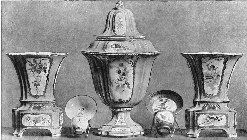
Rose-Pompadourvasen von 1757 und 1763. (Königliche Schlösser.)

Ein Satz von drei Rose-Pompadourvasen aus königlichem Besitz, zog auf unserer Ausstellung Aller Augen auf sich. Die mittlere eine Bechervase mit Deckel, die Seitenstücke hohe Jardinières mit durchbrochenem Untersatz. In den von Goldornamenten umrahmten ausgesparten Feldern sind Puttenscenen in Bouchermanier,