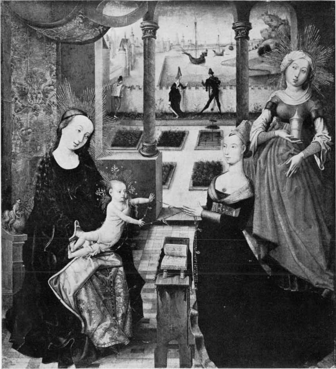
Fig. 8. MAITRE DE SAINTE-GUDULE : LA VIERGE ET L'ENFANT AVEC LA MADELEINE ET UNE DONATRICE (VERS 1470). LIÈGE, MUSÉE DIOCÉSAIN.

à son époque", dit Friedländer. Et il dit encore: „Hugues van der Goes, Grünewald, Michel-Ange, trois mélancoliques." 1) Il faudrait ajouter Mantegna, dont le génie aussi est puissant, et ne sourit pas.