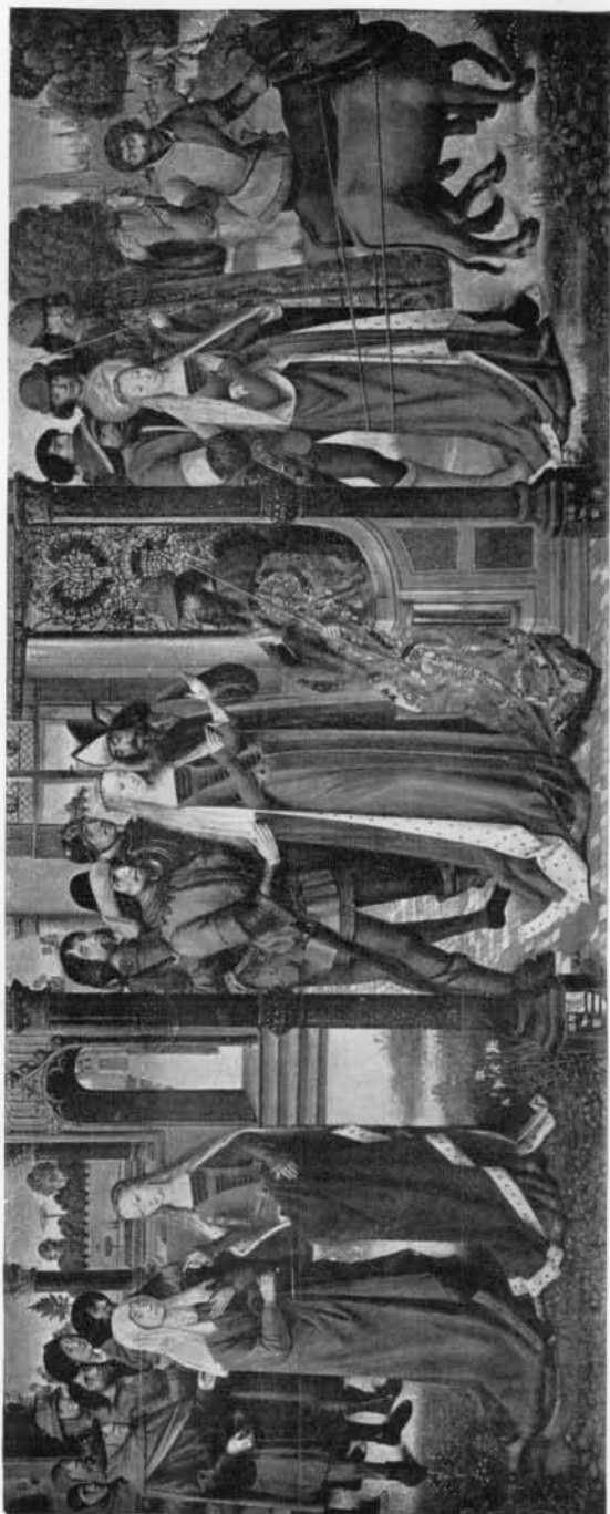
Fig. 11. MAÎTRE DE LA LÉGENDE DE SAINTE LUCIE; LA LÉGENDE DE SAINTE LUCIE. ÉGLISE SAINT-JACQUES, BRUGES.

des tons sombres et moelleux qui font penser à Memling; mais son tableau-type, celui de Saint-Jacques à Bruges, est plus caractéristique et plus personnel. La recherche d'une gamme claire et harmonieuse, la qualité du dessin, savant et sûr, bien que marqué déjà d'un peu de maniérisme qui se perçoit dans les proportions très allongées de la figure de la sainte, le raffinement et le choix des éléments de cette oeuvre, son accent enfin, établissent sa filiation avec l'art de Van der Goes.