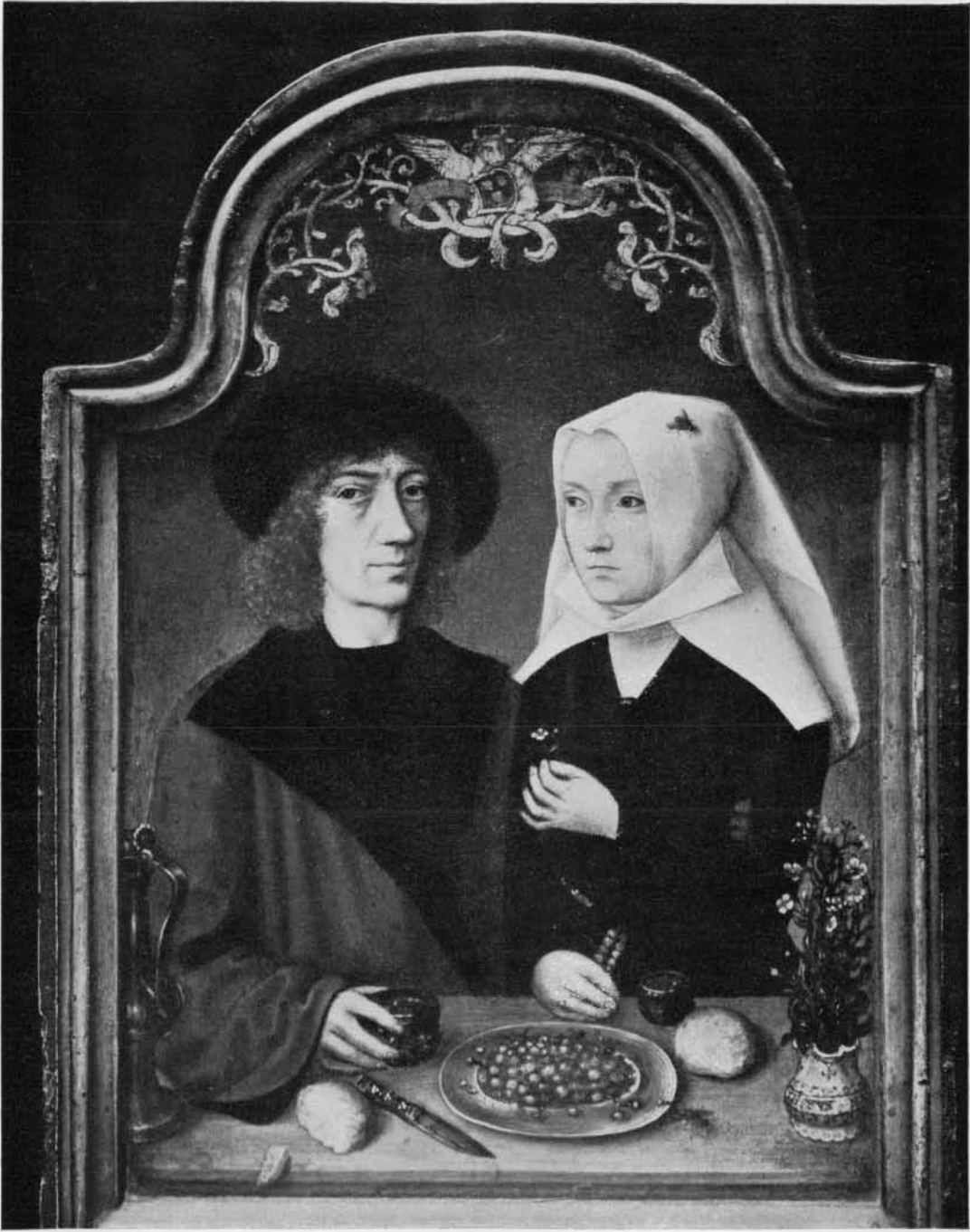
Fig. 12. LE MAÎTRE DE FRANCFORT : L'ARTISTE ET SA FEMME, (tableau daté 1496). COLL. STÉFAN VON AUSPITZ, VIENNE.