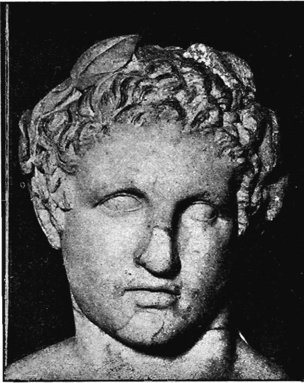
Matz-Duhn, 138. Vorstehend abgebildet. Der Marmor ist zwar etwas grosskörnig, ich kann ihn aber nicht für 'parisch' halten.

8. Rom, Palazzo Corsini, II. Zimmer. Kopf.