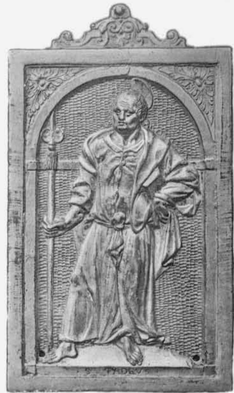
141 [P o ]