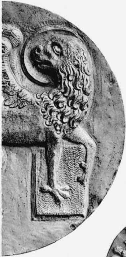
62 nat. Größe]