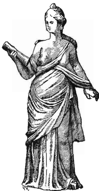
Statuette trouvée à Myrina.

Une preuve de la justesse de notre opinion nous est fournie par une statuette de Myrina qui est entrée au Musée du Louvre et qui doit prochainement être publiée 1 . Son attitude, son costume, rappellent tellement la prétendue Pythie qu'on peut considérer ces deux figures comme inspirées par un modèle commun. Or, la statuette de Myrina, qui tient un rouleau, est évidemment une Muse; les Muses sont assez fréquentes parmi les terres cuites grecques et la nécropole de Myrina en a fourni plusieurs. Nous n'hésitons donc pas à penser que l'hypothèse de la Pythie est à rejeter et que le personnage à gauche d'Apollon représente une Muse tenant un rouleau.