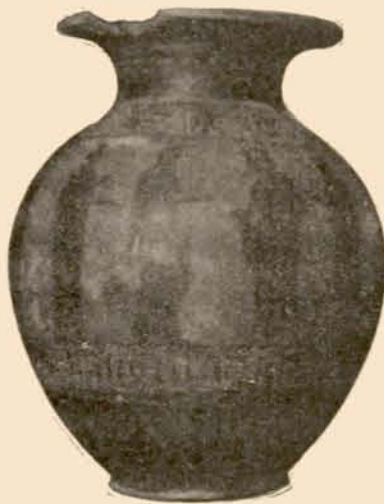
FIG. 5. — Stamnos à figures noires (Collection Saint-Ferriol).

Dans le revers B, le profil d'Héraklès fautif, déformé par les retouches qu'il a subies, est suspect, de même la massue près de la main, le bout du pied gauche, la tête du serpent dans la main du héros, celle qui touche terre à gauche et le coq de gauche. Dans le travail maladroit des retouches, les têtes de l'hydre mordant le bras et la cuisse gauches, primitivement incisées en blanc, ont été recouvertes de noir. Évidemment ce sont là autant de motifs de restriction qui viennent compliquer les doutes que suggère cette figure déjà anormale, et, encore une fois, tout en faisant connaître le vase, je me retranche dans la plus prudente des réserves à son égard.