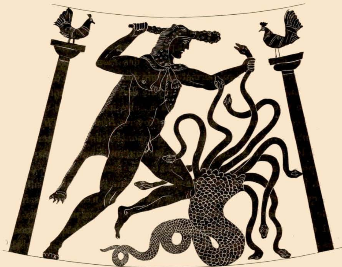
FIG. 3. — Héraclès combattant l'hydre de Lerne, revers d'une amphore panathénaique (Collection Saint-Ferriol).

de la queue squameuse du monstre; du bras droit levé et coudé il tient la massue noueuse en l'air horizontalement et passée derrière sa tête (geste quelque peu conventionnel); du bras gauche allongé il tient serré dans son poing un des cous de serpent de