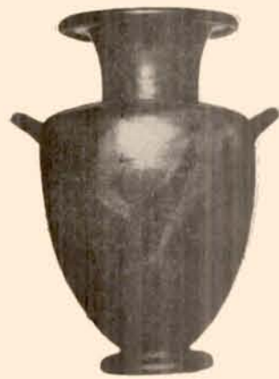
FIG. 1. — Hydrie à figures rouges (Collection Saint-Ferriol).

sortir de l'oubli aboutit à une étude que j'eus le souci de rendre aussi complète qu'il m'était permis. Ce travail terminé, il se trouva qu'une pièce, parmi les plus saillantes de la collection, occupa d'une façon persistante mon attention et m'imposa des recherches minutieuses; non pas qu'elle brille d'un éclat saisissant, car l'aspect en est sombre et le style sévère, mais le sujet d'abord, grand et simple,