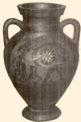
FIG. 7. — Amphore à figures noires (Collection Saint-Ferriol).