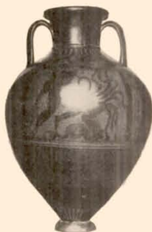
FIG. 2. — Amphore panathénaïque (Collection Saint-Ferriol).

Le vase suivant est une amphore panathénaïque de grandes dimensions, à deux anses dont le corps est triangulaire et à deux tableaux; figures noires incisées. Haut: 0,645; moitié du pourtour: 0,675. — Il porte le n° 182 de la collection (fig. 2).