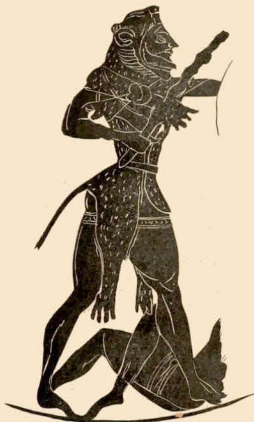
FIG. 8. — La figure d'Héraklès sur l'amphore de la Géryonie (Collection Saint-Ferriol).

par une ceinture, les pattes nouées sous le cou, la massue dans la main droite, le bras gauche étendu en avant et masqué à moitié par le bord d'un bouclier, combat le triple Géryon figuré par trois guerriers massés devant lui. Le corps du berger Eurytion est à terre aux pieds du héros, appuyé sur un bras, l'autre relevé comme pour se protéger. Les trois guerriers portent des armures, des cnémides, des casques à haut cimier et de grands boucliers leur masquant le haut du corps. Leurs visages ne sont que peu visibles et leurs armes ne le sont pas du tout. Une seule lance apparaît horizontale et presque effacée à la hauteur des têtes; leurs jambes sont symétriquement portées en avant et en arrière. Un seul d'entre eux, barbu, retourne le haut du corps comme pour appeler à l'aide ou quitter la lutte, ce qui permet de voir sa tête casquée, sa cuirasse, ses bras nus, le dedans de son bouclier et la lance qu'il tient pointe en bas. Des deux autres boucliers, celui de devant, visible en entier et qui masque le second aux trois quarts, porte en épisème un grand décor de larmes grosses et petites disposées alternativement en rayons autour d'un petit disque central, le tout figuré en blanc; la bordure autour est en brun roux.