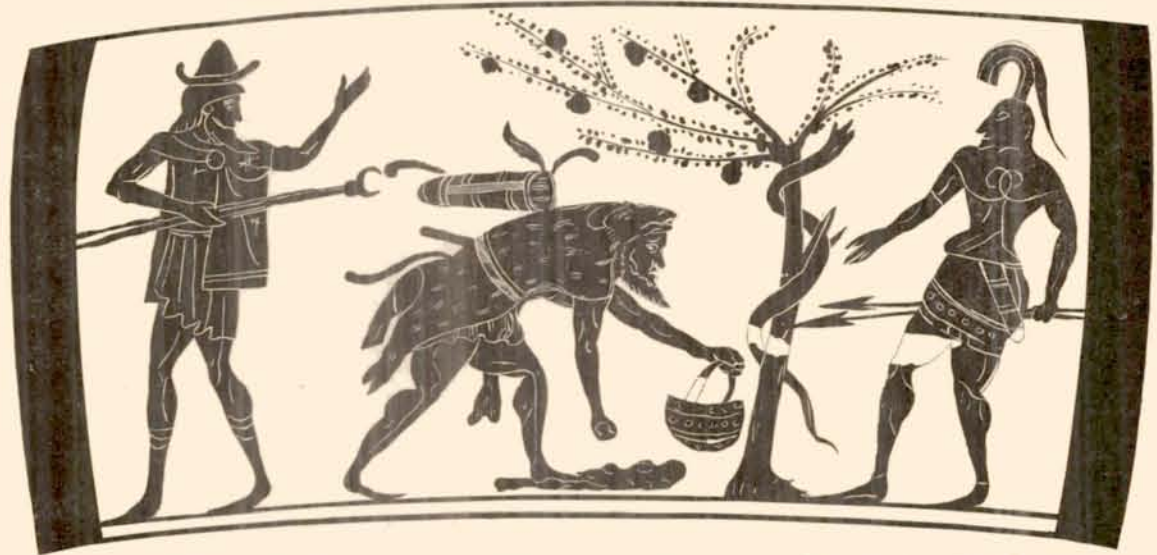
FIG. 6. — Héraklès au Jardin des Hespérides, sur un stamnos de la Collection Saint-Ferriol.

de l'arbre merveilleux dont les rameaux feuillus portent de gros fruits ronds et sous lequel il se montre le corps ainsi baissé. Le serpent Ladon, enroulé au tronc de l'arbre, paraît avoir une tête formant trois pointes sans que le dessin grossier la précise autrement. Au-dessus du dos d'Héraklès, carquois muni de deux lanières volantes et de son couvercle en forme d'aile ou de ce qui servait de couvercle. Tout en conjecturant aisément le sens de la