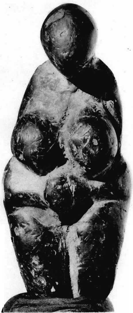
Statuette de femme nue en stéatite (Grotte de Menton).