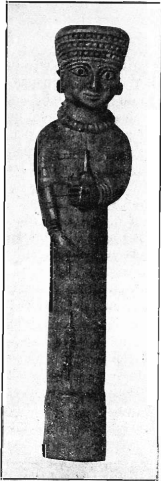
Fig. 1. — La Dame au Fuseau.

Rappelons d'autre part que, dès la première publication des fouilles