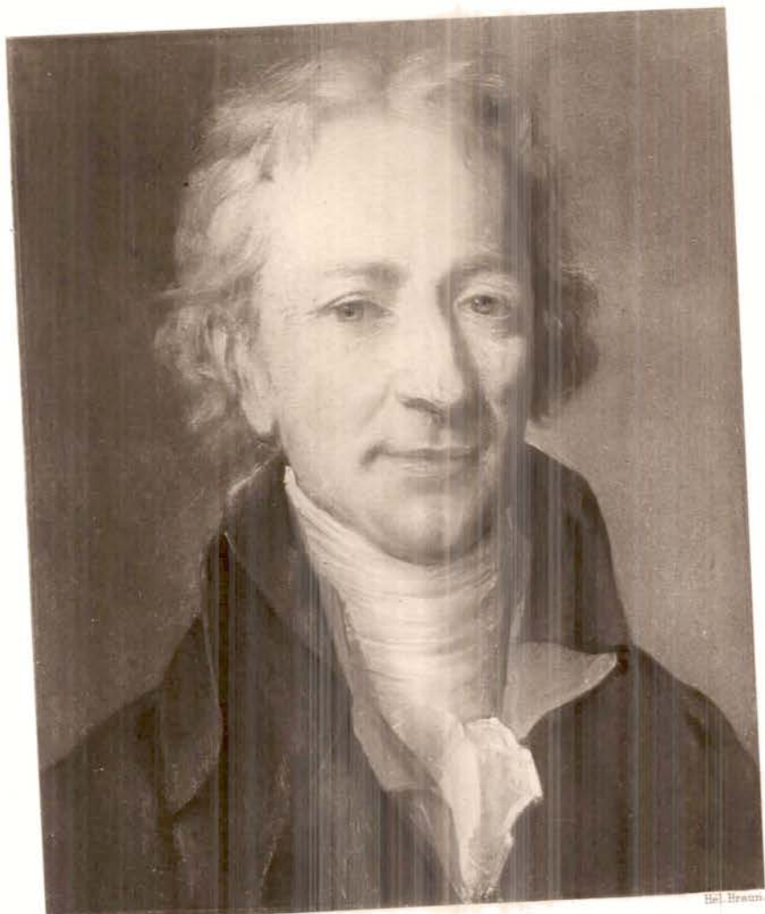
Angelica Kauffmann pinx.