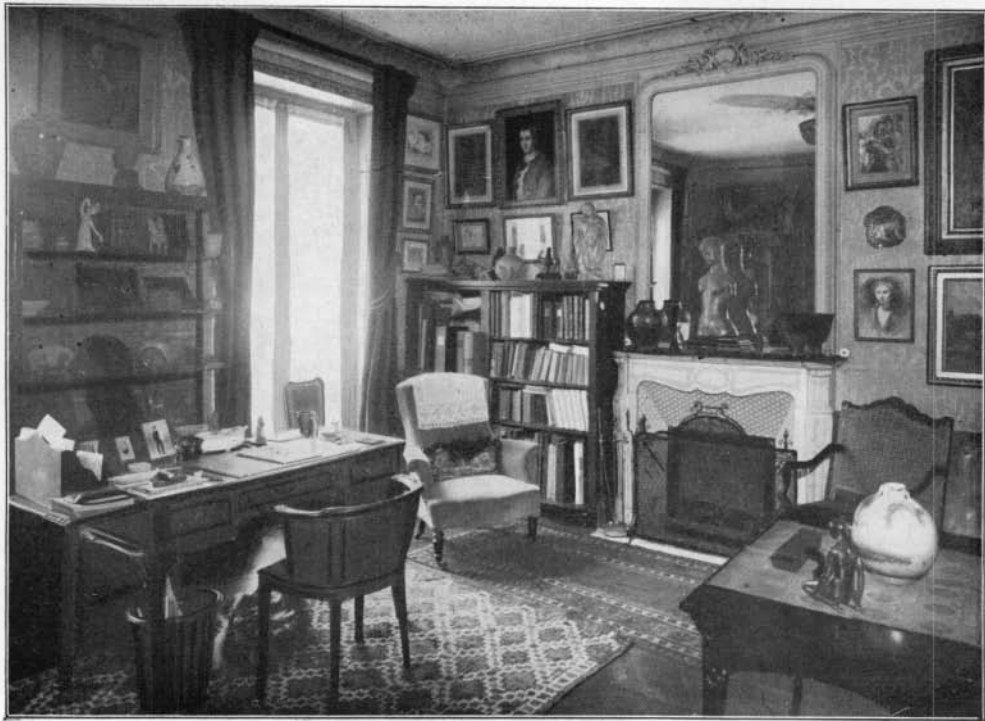
LE SALON DE RAYMOND KÉCHLIN, 14, BOUL. SAINT-GERMAIN.