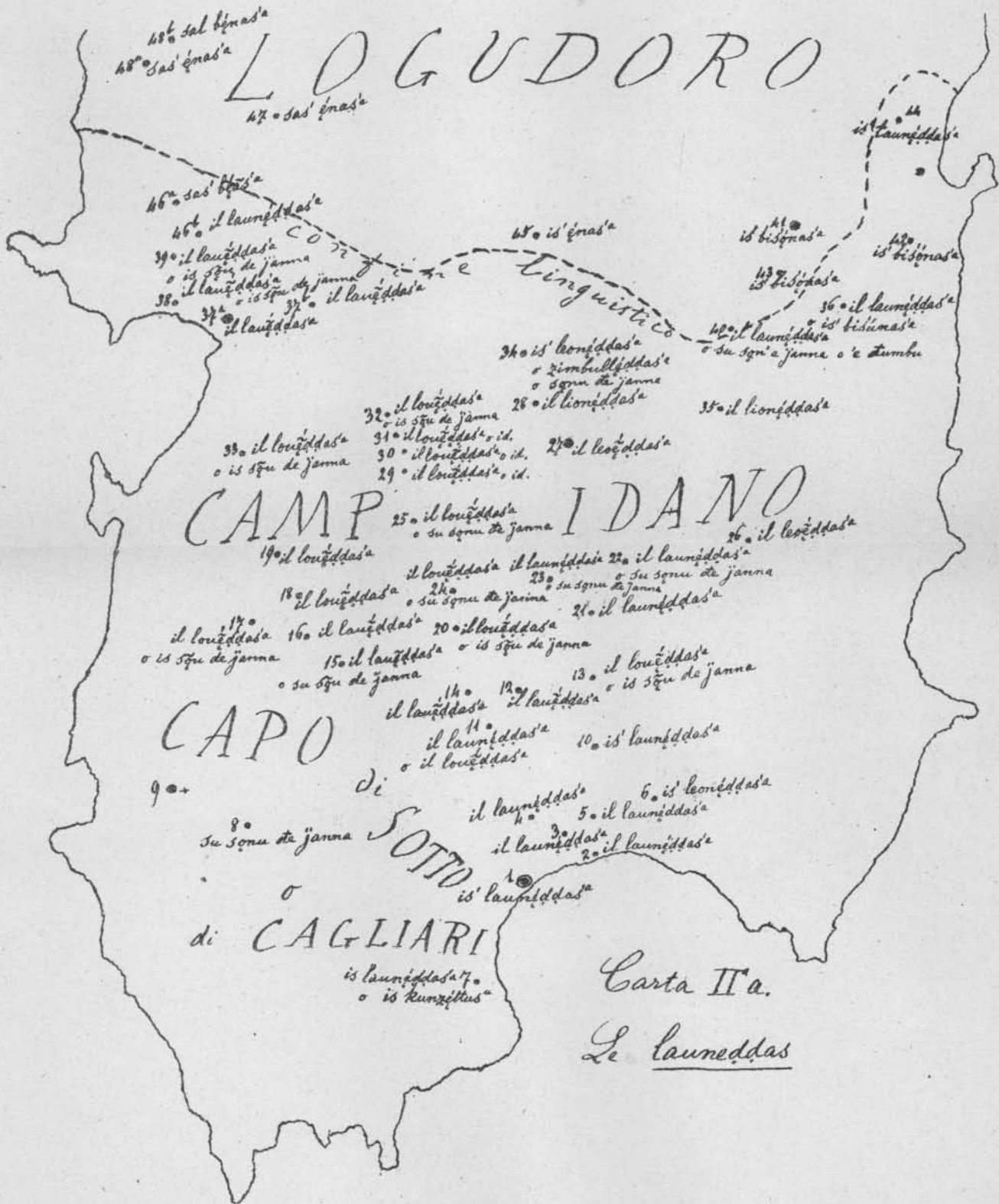
Carta II a . Le launeddas