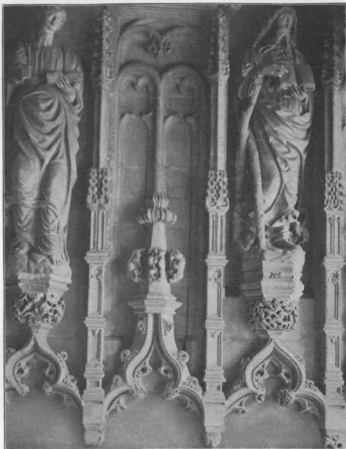
STATUES D'APÔTRES décorant le porche septentrional de l'Église N.-D. à Tongres (1532).