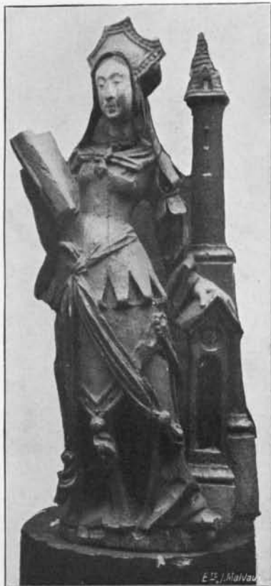
SAINTE BARBE : Bois. Première moitié du XVII e siècle. (Musée communal de Verviers).