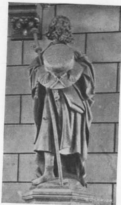
SAINT JACQUES LE MAJEUR.