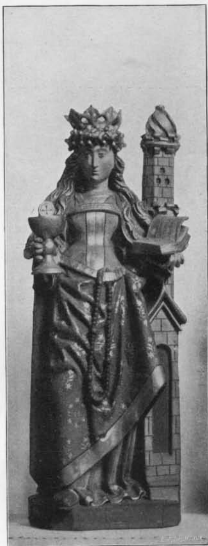
SAINTE BARBE : Bois. Premier tiers du xvi e siècle. (Musée diocésain de Liège).