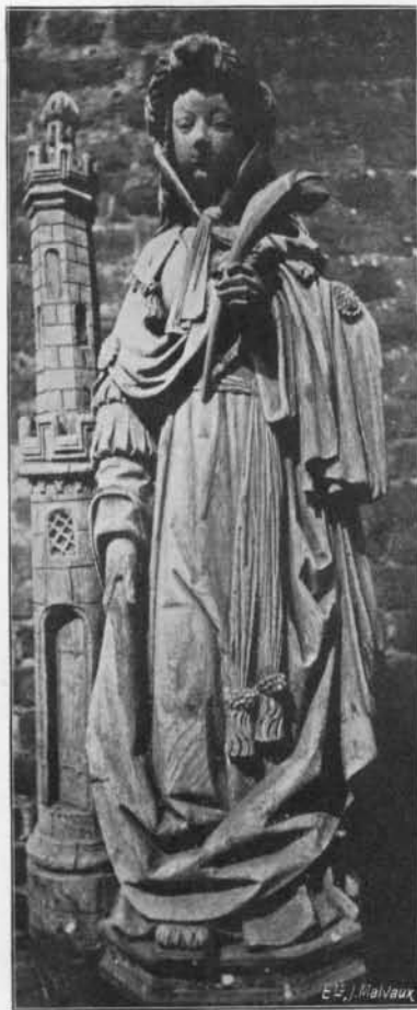
SAINTE BARBE : Bois. Premier tiers du XVII e siècle. (Église de Neeroeteren).