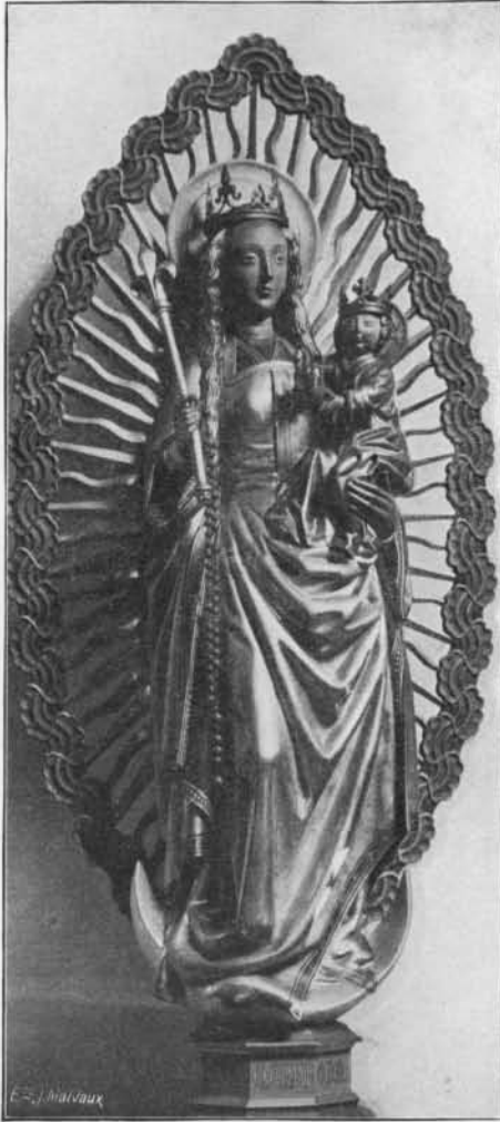
VIERGE IMMACULÉE. Bois. Prem. quart du XVI e s. (Musée diocésain de Liège).

tiennent les feuillets entr'ouverts. C'est un chef-d'œuvre d'un de nos derniers sculpteurs gothiques, et sa valeur artistique rend fort importante la détermination de sa provenance. Elle ne porte pas de marque de fabrique. A quel milieu faut-il l'attribuer ? Je ne vois point dans la sculpture brabançonne quelque chose qui lui ressemble, dans ses proportions un peu massives, dans le caractère de ses draperies, dans la douceur vivante de son beau visage et de ses mains magnifiques. Mais dans le Limbourg même il existe des statues qui sont du même style et qui peuvent témoigner de son origine. Ce sont les statues du Saint Sépulcre de Brée. Dans les figures des trois saintes Femmes et des deux anges respectueux qui veillent le Christ, — dont le corps est d'un dessin savant, d'un modelé nuancé et qui n'a rien des formes anguleuses caractérisant les Christs brabançons et allemands, — on retrouve le même charme et la même tendresse, la même mesure dans l'expression, la même justesse d'attitude, la même beauté simple, noble et touchante. Les mains de ces anges et de ces saintes Femmes ont la