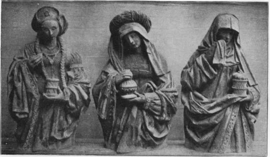
SAINT-SÉPULCRE DE BRÉE. (Limbourg belge). Les Saintes Femmes.

l'action des eaux de pluie accumulées s'infiltrant dans les murs. A l'extérieur de cette vieille église, une pierre, sculptée en haut-relief, porte l'image grossièrement esquissée, d'une abbesse. Cette pierre, placée actuellement très haut, dans un mur, et tout usée par son long séjour en plein air, est difficile à interroger quant à son style et à sa facture. Mais les églises de Saint-Trond regorgent de statues. Il en est, à vrai dire, beaucoup qui ne présentent guère d'intérêt; elles sont du XVII e et du XVIII e siècle et répètent, souvent sans accent, des types plus anciens, mais il en est d'autres qui ont une véritable valeur d'art : à Saint-Martin, les deux jolies statues équestres du patron de l'église et une sainte Anne dont le socle est supporté par des putti; à Saint-Gangulphe, à l'église de Schurhoven, il y a des statues archaïques et curieuses; à l'église des Frères-Mineurs, il y a plusieurs jolies statues du XVII e