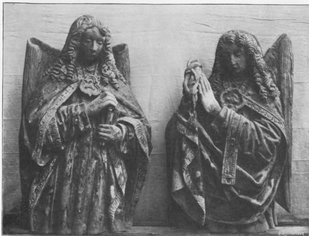
SAINT SÉPULCHRE DE BRÉE : LES ANGES.