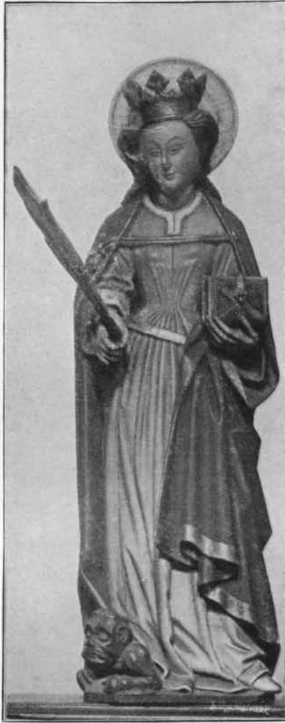
SAINTE MARGUERITE (?)

Bois. — Fin du xv e siècle. (Église Saint-Quentin à Hasselt).