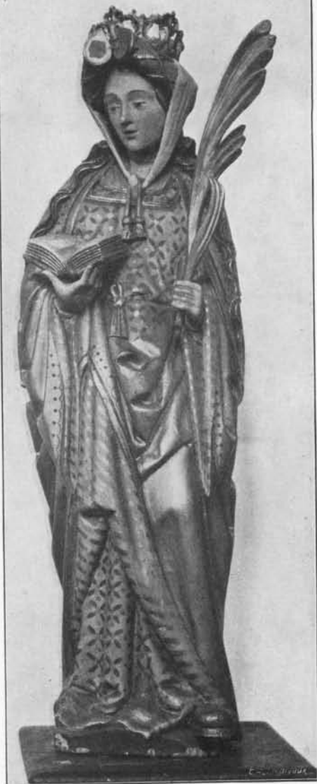
SAINTE LUCIE : BOIS. Premier tiers du XVI e siècle. (Église Notre-Dame à Saint-Trond).