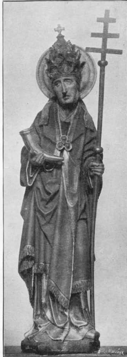
SAINT CORNEILLE, PAPE. BOIS. Premier tiers du xvi e siècle. (Église Saint-Quentin, Hasselt).