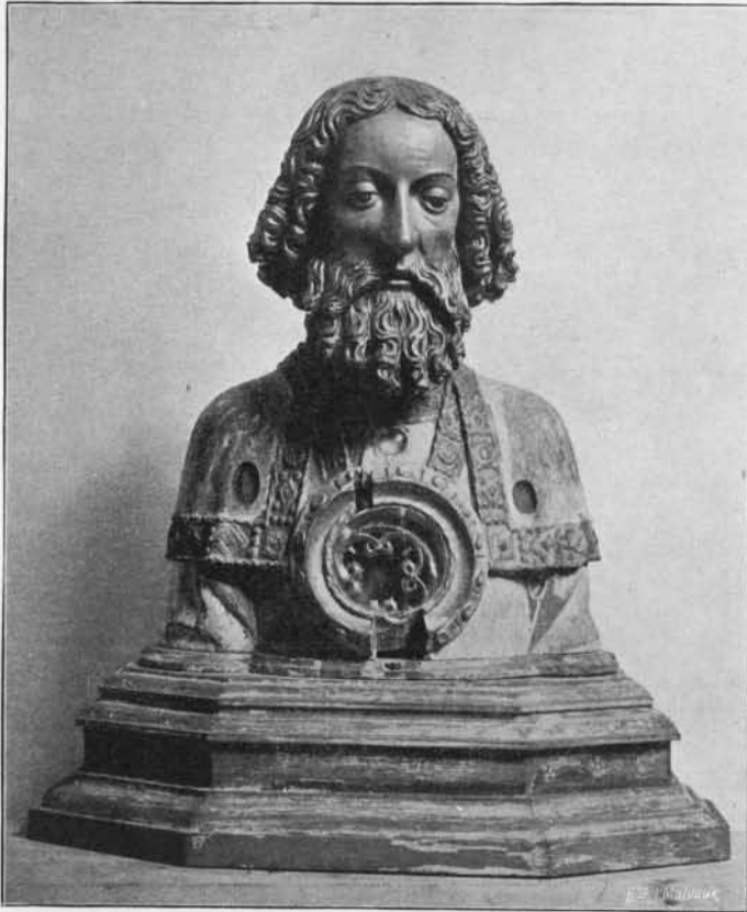
BUSTE-RELIQUAIRE DE SAINT BARTHÉLEMY : Bois. Prem. tiers du xvi e siècle. Provient du Couvent des Bégards à Zepperen. (Musée diocésain de Liège).

et du xviii e siècle et, dans les locaux conventuels, une belle Vierge des Douleurs; à l'extérieur de l'hôtel de ville, dans une niche, est placée une fine et élégante Vierge du xvi e siècle, et enfin, l'église Notre-Dame possède plusieurs statues qui valent d'être étudiées. Nous ne nous occuperons pas du