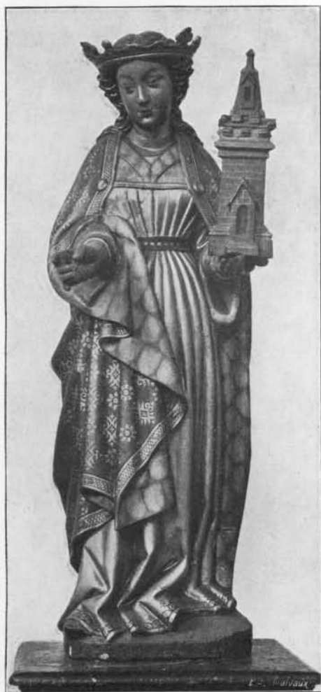
SAINTE BARBE : BOIS. Commencement du XVI e siècle. (Église Notre-Dame à Saint-Trond).