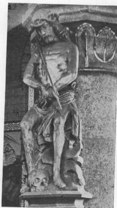
LE CHRIST AU CALVAIRE. (Église de Neeroeteren).