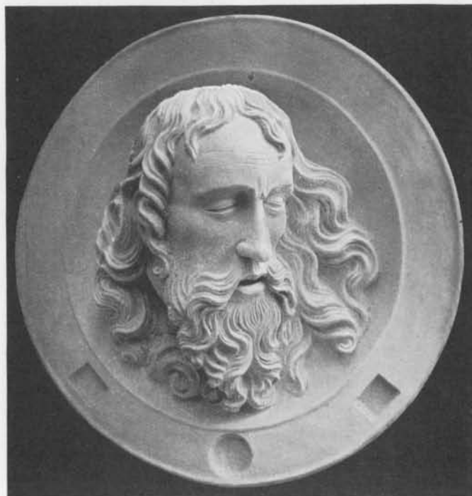
JEAN DE WEERT : Saint Jean-Baptiste (1508). (App. à la Comp. de Charité à Liège).

tête reliquaire qui appartient à l'ancienne Compagnie pour le secours des Pauvres et des Prisonniers, fondée à Liège en 1624 par le prince-évêque Ferdinand de Bavière. Elle est d'un travail soigné, d'un style élégant, et elle reste expressive et noble malgré ce qu'elle a de trop minutieux dans son exécution et d'un peu factice dans son expression. On connaît les nombreuses têtes de saint Jean-Baptiste sculptées en albâtre dans les ateliers anglais du xv e et du xvi e siècle. Elles sont, pour la plupart, sans vérité et