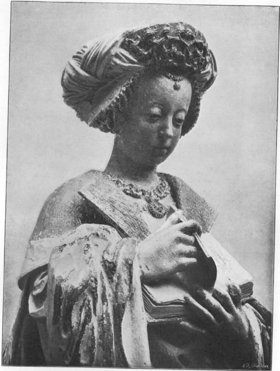
SAINTE BARBE : Bois. Première moitié du xvi e siècle. Jadis à Maeseyck, à présent dans une collection privée à Berlin (Fragment).