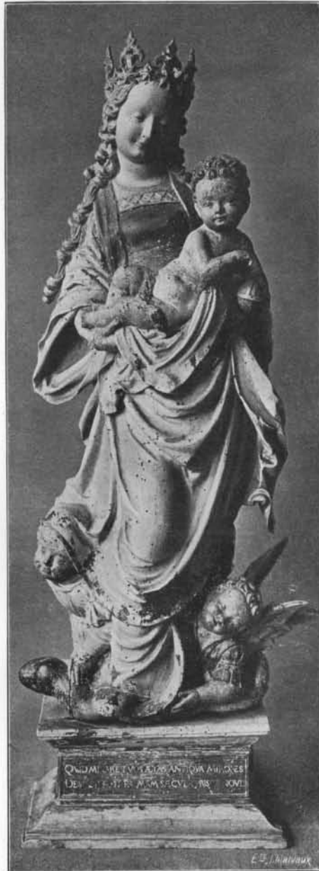
DANIEL MAUGHUIS : Vierge. († 1530). (Église de Dalhem).

Vers le temps où l'art gothique, bien qu'il ait triomphé encore dans la Renaissance réaliste du xv e siècle, essaie ainsi de rénover ses aspects par des procédés vieilliss, puérils et souvent inefficaces, il lui arrive d'exprimer un goût plus heureux et de revêtir de beauté, par des moyens plus simples et plus logiques, quelques-unes de ses dernières œuvres. Jamais la fantaisie, la grâce et la richesse n'ont été mieux combinées que dans certaines statues qui se situent approximativement entre 1530 et 1540. Au nombre de celles que nous avons conservées, nous citerons la sainte Barbe et la sainte Catherine du Musée archéologique de Namur, la sainte Catherine du château de Vierves, qui provient de l'église paroissiale, la sainte Barbe du musée communal de Verviers, la sainte Catherine de l'église de Celles, la sainte Dorothee du musée diocésain de Liège, et une sainte Barbe qui était jadis à Maeseyck, et qui, après avoir passé par Anvers et Bruxelles, se trouve à présent dans une collection à Berlin (1). Elle est très belle, très humaine, très vivante, somptueusement et joliment vêtue, avec des étoffes aux longs plis souples, profonds et moelleux; elle penche un visage jeune, doux et attentif sur son livre d'heures, dont ses belles mains, potelées et d'une forme parfaite,