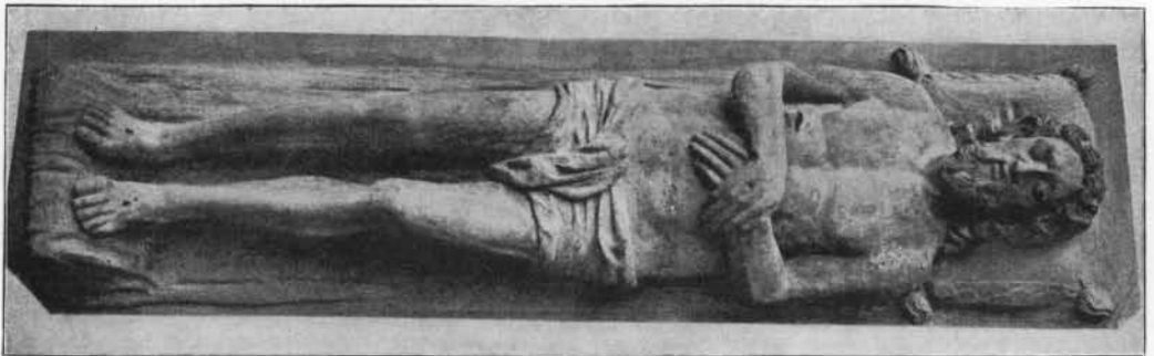
SAINT SÉPULCRE DE BRÉE : Le Christ.

l'action des eaux de pluie accumulées s'infiltrant dans les murs. A l'extérieur de cette vieille église, une pierre, sculptée en haut-relief, porte l'image grossièrement esquissée, d'une abbesse. Cette pierre, placée actuellement très haut, dans un mur, et tout usée par son long séjour en plein air, est difficile à interroger quant à son style et à sa facture. Mais les églises de Saint-Trond regorgent de statues. Il en est, à vrai dire, beaucoup qui ne présentent guère d'intérêt; elles sont du XVII e et du XVIII e siècle et répètent, souvent sans accent, des types plus anciens, mais il en est d'autres qui ont une véritable valeur d'art : à Saint-Martin, les deux jolies statues équestres du patron de l'église et une sainte Anne dont le socle est supporté par des putti; à Saint-Gangulphe, à l'église de Schurhoven, il y a des statues archaïques et curieuses; à l'église des Frères-Mineurs, il y a plusieurs jolies statues du XVII e