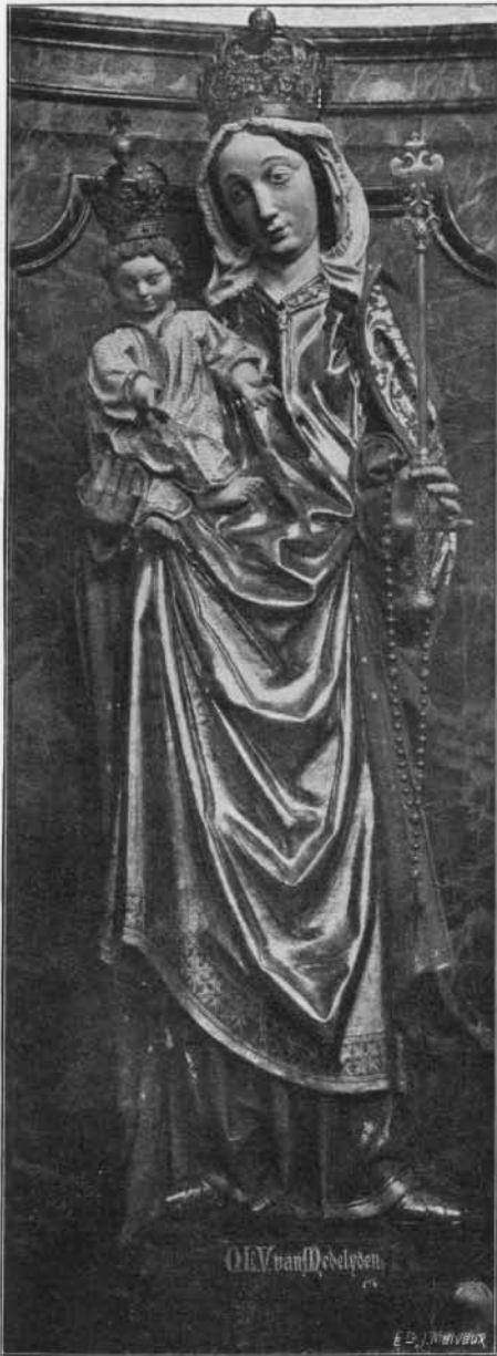
NOTRE-DAME DE LA COMPASSION. Bois. Prem. quart du xvi e siècle. (Église des Frères-Mineurs Saint-Trond).

de la production artistique de cette région. Elles ont un aspect vivant et réaliste, fort différent de celui de la Vierge placée dans une niche à l'extérieur de l'hôtel de ville et qui conserve un caractère idéalisé.