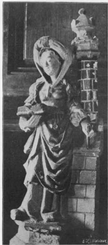
SAINTE BARBE : Bois. Premier quart du XVII e siècle. (Église de Freeren).