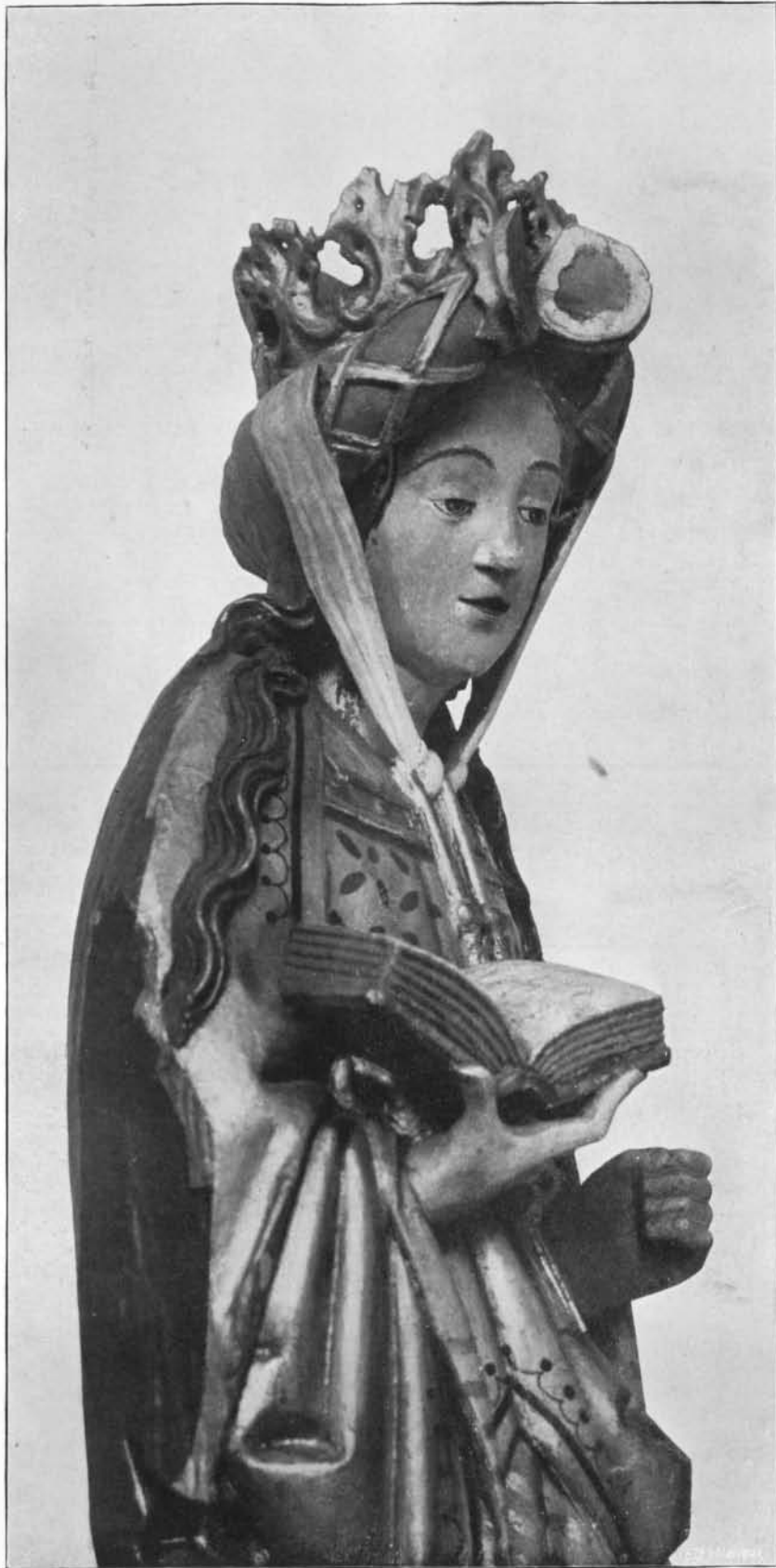
SAINTE LUCIE : Détail de la statue à l'Église Notre-Dame à Saint-Trond.