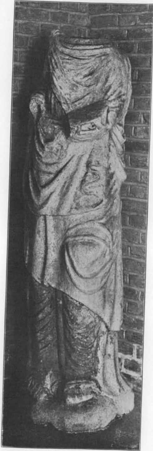
STATUE D'APÔTRE (?): Pierre. Prem. tiers du XVI e s. Trouvée sur l'emplacement de l'ancien Château des Templiers, à Villers-le-Temple, (Musée arch. de Liège).

ment dessinés et lui donnent une ressemblance avec le saint Corneille de Hasselt: les yeux ont à peu près la même forme, la paupière supérieure étant rectiligne, la paupière inférieure étant au contraire fortement incurvée; même type de nez aussi, long, droit et assez lourd; même dessin de la bouche aux coins abaissés. Les deux œuvres sont peut-être d'artistes différents mais qui appartiennent au même milieu, à la même école.