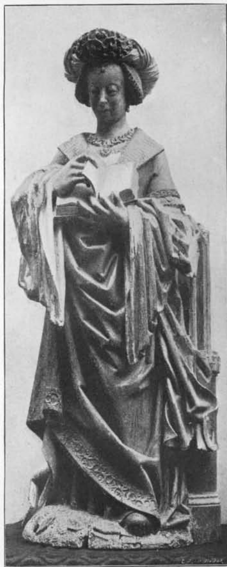
SAINTE BARBE : BOIS. Première moitié du XVI e siècle. (Jadis à Maeseyck, à présent dans une collection privée à Berlin).