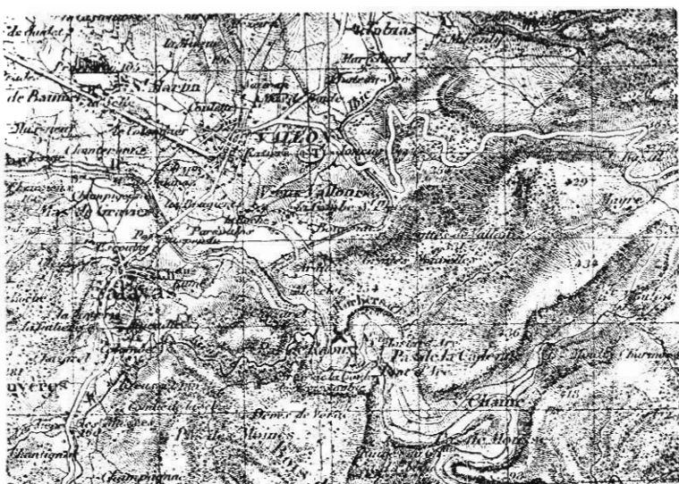
Extrait de la carte E.M. au 1 : 50.000

Je n'ai pu voir cette station que dans le mois d'avril 1930. De nombreux visiteurs avaient malheureusement bouleversé le sol sans beaucoup de méthode et en avaient tiré un certain nombre d'objets, petits vases en terre cuite, statuettes, monnaies qui sont pour la plupart dispersés ; mais dont un certain nombre a pu nous être montré.