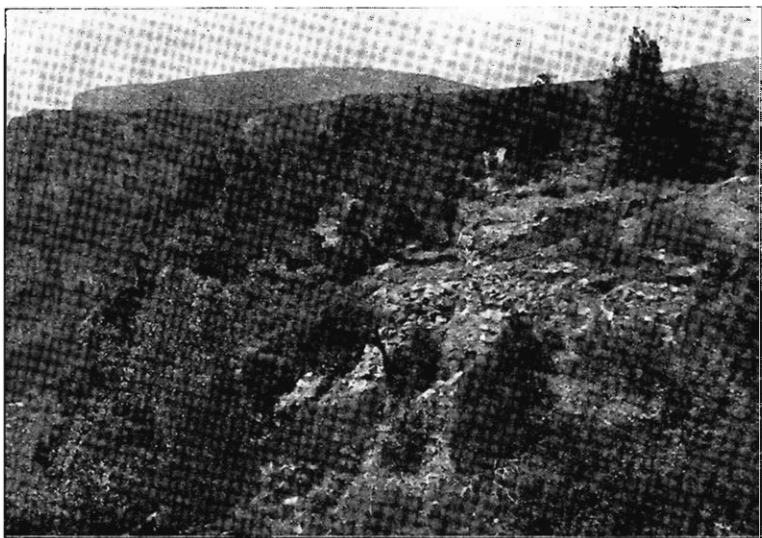
Vestiges du poste Romain

J'ai consacré 4 journées de travail à la fouille de la partie de l'éperon où se voient des vestiges de maçonnerie, circonscrivant des pièces d'habitations de forme rectangulaire dont l'une mesure 3 m. × 5 m. de superficie. Sur le versant ouest de l'éperon, se voit nettement une fosse cimentée qui a dû servir de citerne.