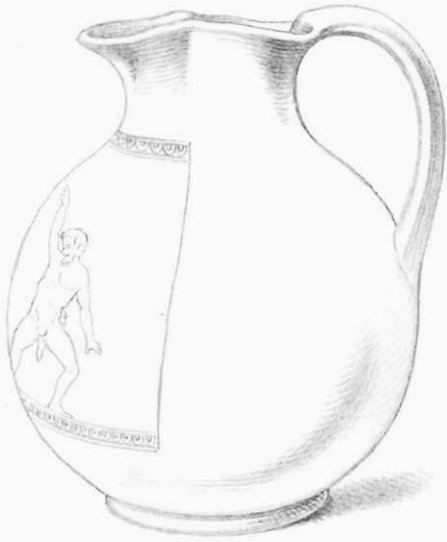
Form der Vase.