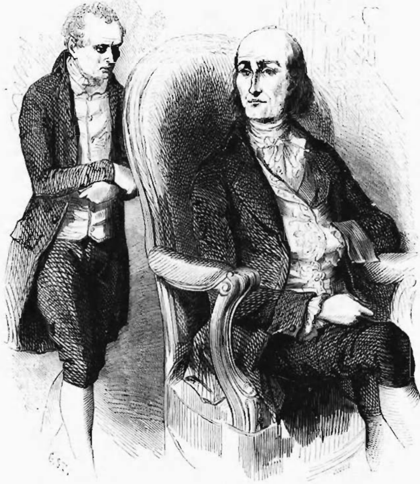
Le marquis d'Esgrignon et le notaire Chesnel. — PAGE 8.

— Les temps sont bien changés, dit Chesnel en branlant sa tête de laquelle Victorien avait fait tomber les derniers cheveux. Notre roi martyr n'est pas mort comme Charles d'Angleterre.