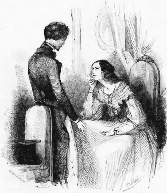
La duchesse écoutait comme elle savait écouter, le comte appuyé sur son genou levé très-haut. — PAGE 18.

l'asthme. Il avait pour femme une grande créature solennelle et dégingandée qui s'affublait des modes les plus ridicules, et se parait excessivement. La présidente se donnait des airs de reine, elle portait des couleurs vives, et n'allait jamais au bal sans orner sa tête de ces turbans si chers aux Anglaises, et que la province cultive avec amour. Riches tous deux de quatre ou cinq mille livres de rente, ils rémissaient, avec le traitement de la présidence, une douzaine de mille francs. Malgré leur pente à l'avarice, ils recevaient un jour par semaine, afin de satisfaire leur vanité. Fidèle aux vieilles mœurs de la ville où du Croisier introduisit le luxe moderne, M. et madame du Ronceret n'avaient fait aucun changement, depuis leur mariage, à l'antique maison où ils demeuraient, et qui appartenait à madame.