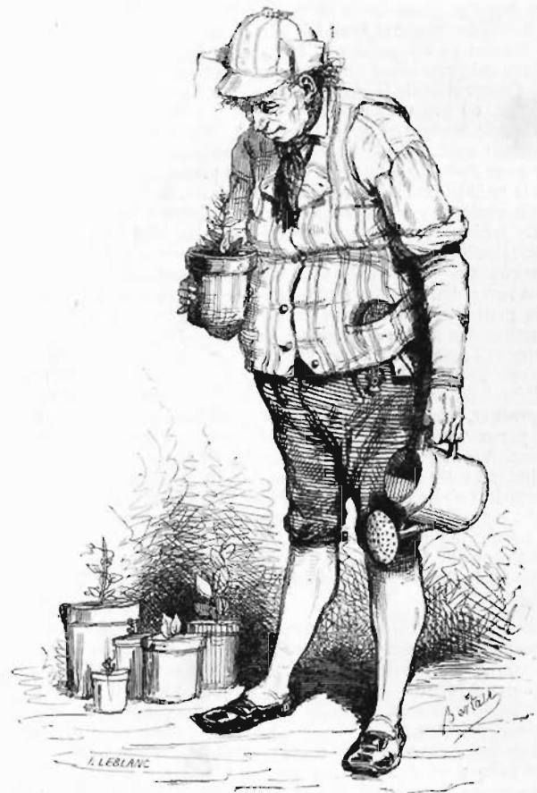
Le bonhomme aimait passionnément l'horticulture... Il avait l'ambition de créer de nouvelles espèces... — PAGE 24

le lança son père, qui d'abord put fournir aux profusions du jeune homme. Cette célébrité précoce, la belle tenue d'Emile, resservirent peut-être les lieux de l'amitié qui l'unissait à la comtesse. Peut-être madame de Montcornet, qui avait du sang russe dans les veines, sa mère était fille de la princesse Sherbeloff, eût-elle renié son ami d'enfance pauvre et lutant avec tout son esprit contre les obstacles de la vie parisienne et littéraire; mais, quand virent les tiraillements de la vie aventureuse d'Emile, leur attachement était inaltérable de part et d'autre. En ce moment, Blondet, que le jeune d'Esgrignon avait trouvé à Paris devant lui à son premier souper, passait pour un des flambeaux du journalisme. On lui accordait une grande supériorité dans le monde politique, et il dominait sa réputation. Le bonhomme Blondet ignorait complètement la puissance que le gouvernement constitutionnel avait donnée aux journaux; personne ne s'avisa de l'entretenir d'un fils dont il ne voulait pas entendre parler; il ne savait donc rien de cet enfant maudit ni de son pouvoir.