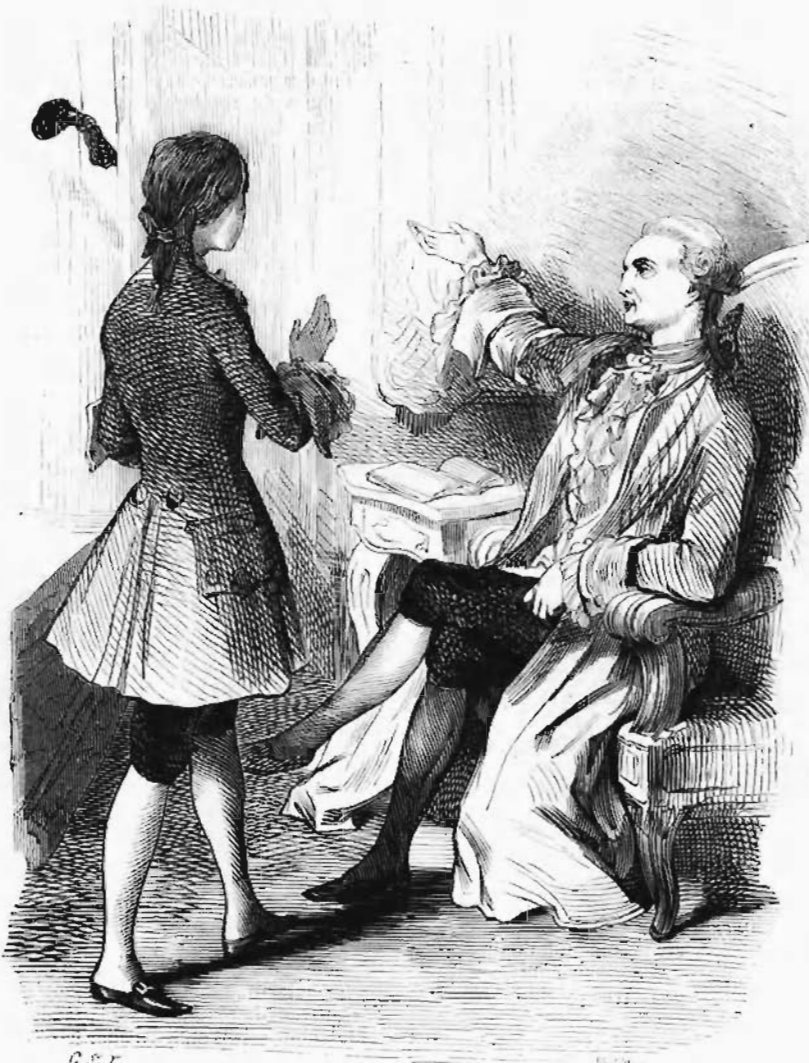
Eh bien! il jeta la bourse par la fenêtre. — PAGE 7.

Mademoiselle Armande tendit sa main, sur laquelle le vieux notaire mit un respectueux baiser