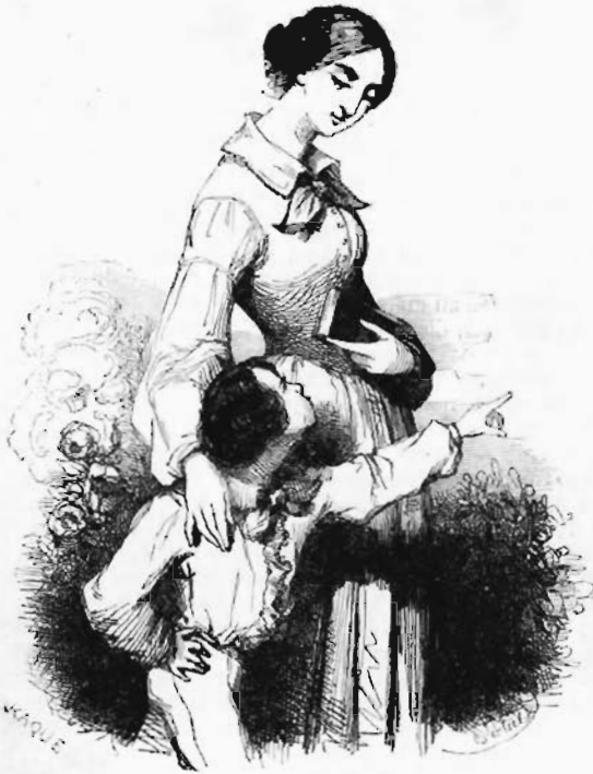
Quand je la voyais venant de loin sur le cours... et qu'elle y amenait Victorien, son neveu... — PAGE 3.

— Quelque chose comme cent mille livres, dit le chevalier en continuant.