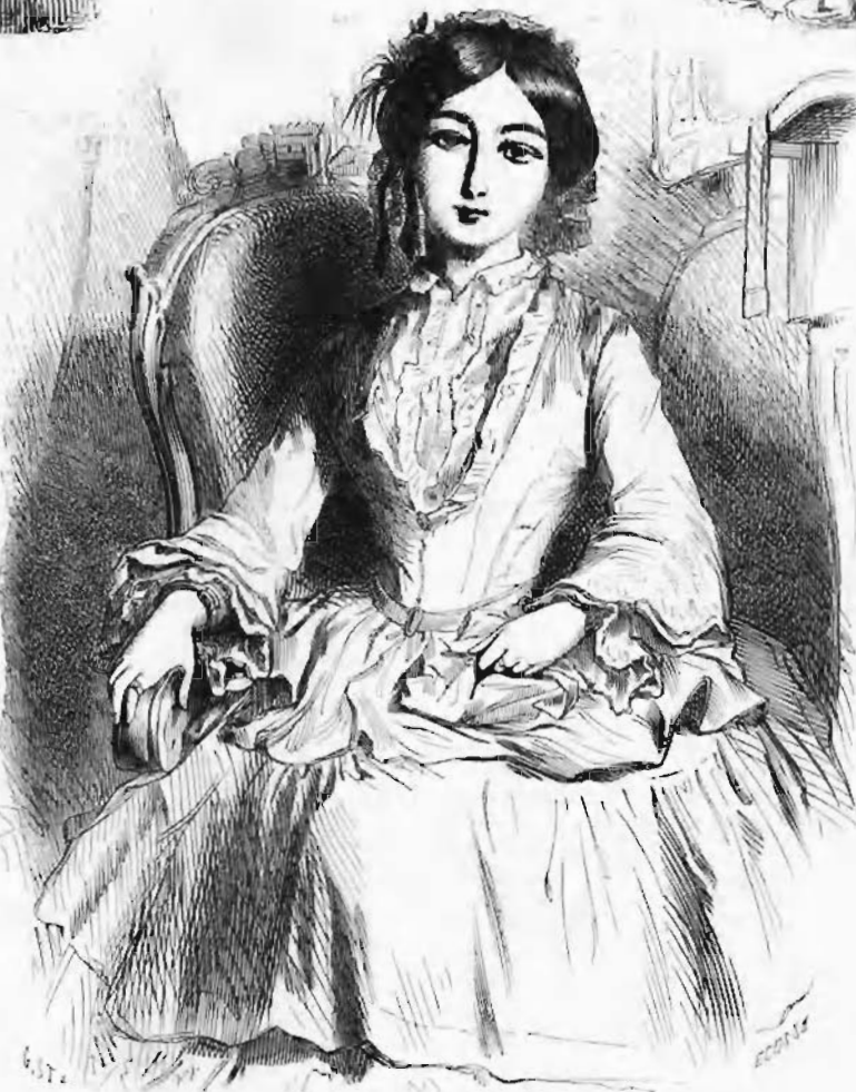
La duchesse de Maufrigneuse.

Vous vous êtes si chaudement intéressé à ma longue et vaste histoire des mœurs françaises au dix-neuvième siècle, et vous avez accordé de tels encouragements à mon œuvre, que vous m'avez ainsi donné le droit d'attacher votre nom à l'un des fragments qui en feront partie. N'êtes-vous pas un des plus graves représentants de la consciencieuse et studieuse Allemagne? Votre approbation ne doit-elle pas en commander d'autres et protéger mon entreprise? Je suis si fier de l'avoir obtenue, que j'ai tâché de la mériter en continuant mes travaux avec cette intrépidité qui a caractérisé vos études et la recherche de tous les documents sans lesquels le monde littéraire n'aurait pas eu le monument élevé par vous. Votre sympathie pour des labours que vous avez connus et appliqués aux