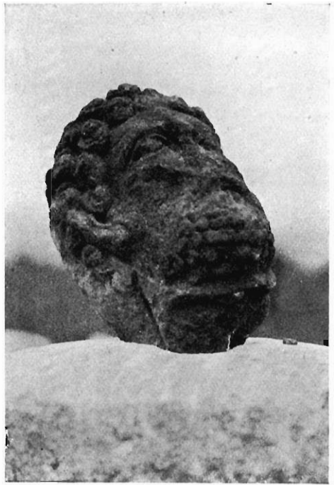
2. — N° 305.