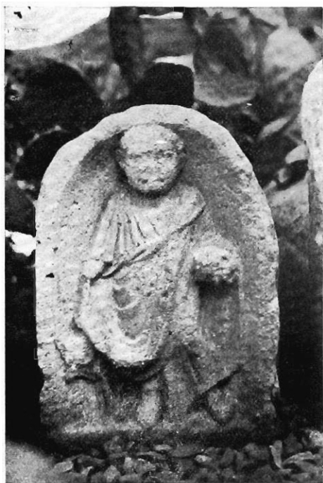
1. — N° 280.