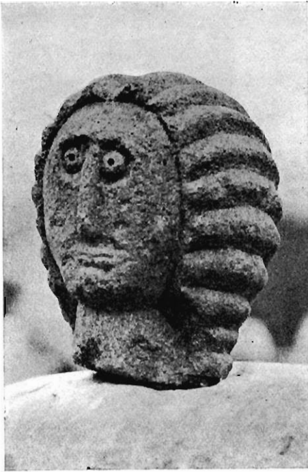
1. — N° 119.