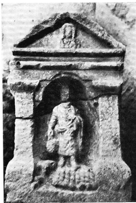
3. — N° 435.