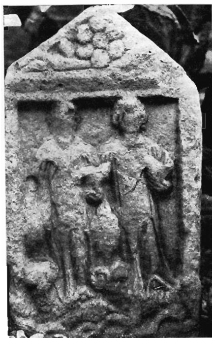
2. — N° 281.