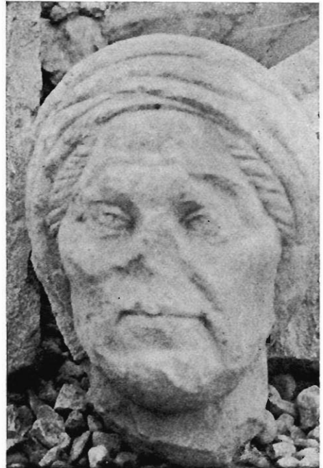
4. — N° 490.