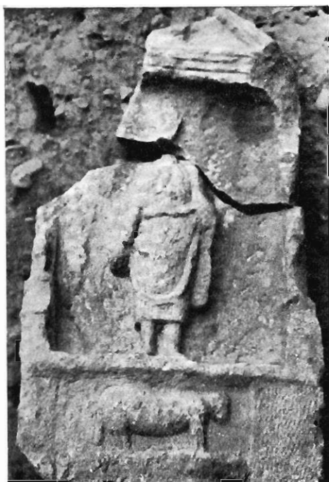
4. — N° 521.

RELIEFS COMMÉMORANT LE SACRIFICE FUNÉRAIRE DU BÉLIER.