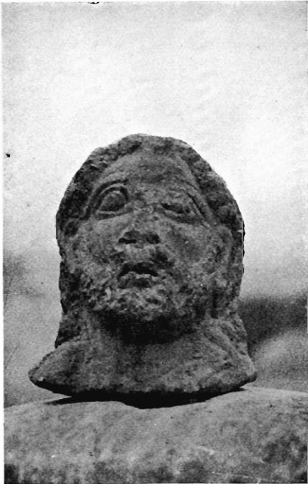
3. — N° 489.