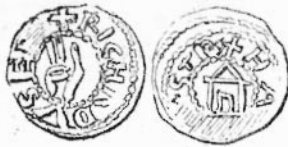
Ma collection. Denier d'argent; 0,94.

R ✠ HA...ASTR. Au centre, un édifice présentant un fronton avec une porte carrée dans le milieu, et ne rappelant plus le temple carolingien. Cette forme d'édifice est très fréquente sur les monnaies d'Otton III.