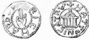
Denier d'argent; 1,10. Musée royal de Copenhague.

longtemps été reproduit par les monnaies de l'ancien royaume de Lorraine.