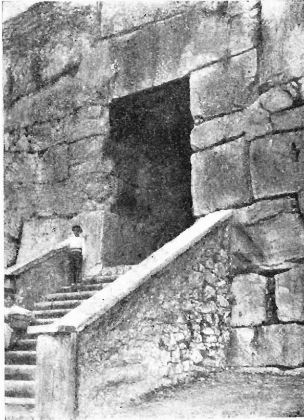
Alatri. Porta Maggiore.

la divinità sovrana propria e particolare degli Hethei-Pelasgi di Siria, d'Asia Minore, dell'isole dell'Egeo e del continente ellenico, fu Set , come si può vedere chiaramente da' nostri studii già pubblicati. Se dunque in Italia e nel Lazio specialmente, vennero e dimorarono gli Hethei-Pelasgi, vi dovette, senza alcun dubbio, regnare il culto del loro dio Set . E qui trattandosi di tempi antichissimi, anzi