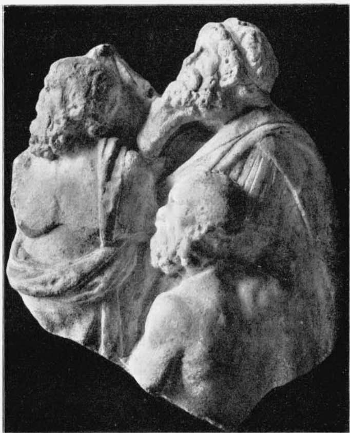
Griechisches Relieffragment (Marmor) 921.