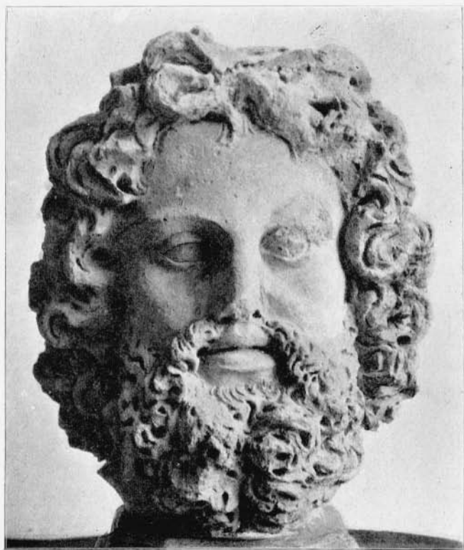
Jupiterkopt in Terracotta)