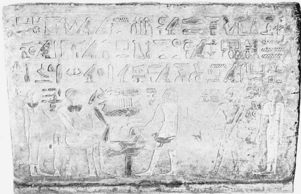
Grabstein des mittleren Reichs.