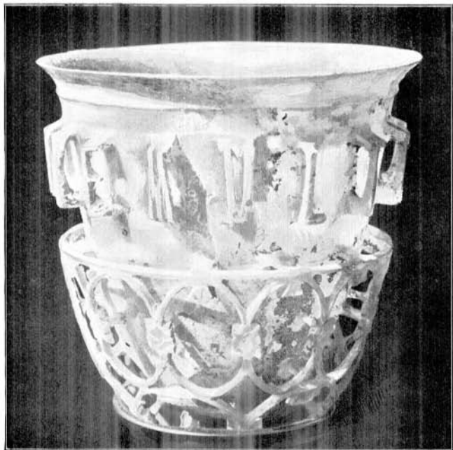
Römisches Glas (vas diatretum)