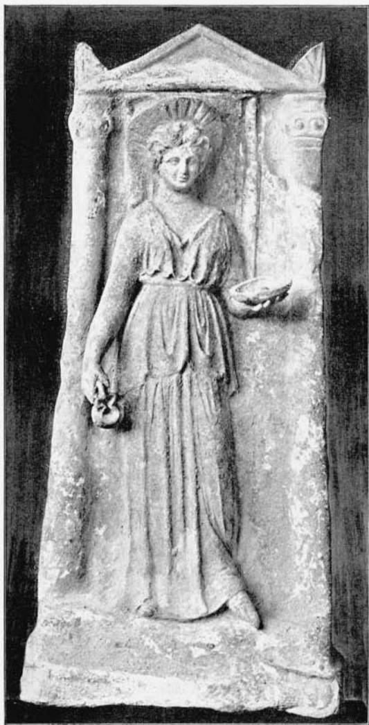
Griechisches Terracottarelief 978.