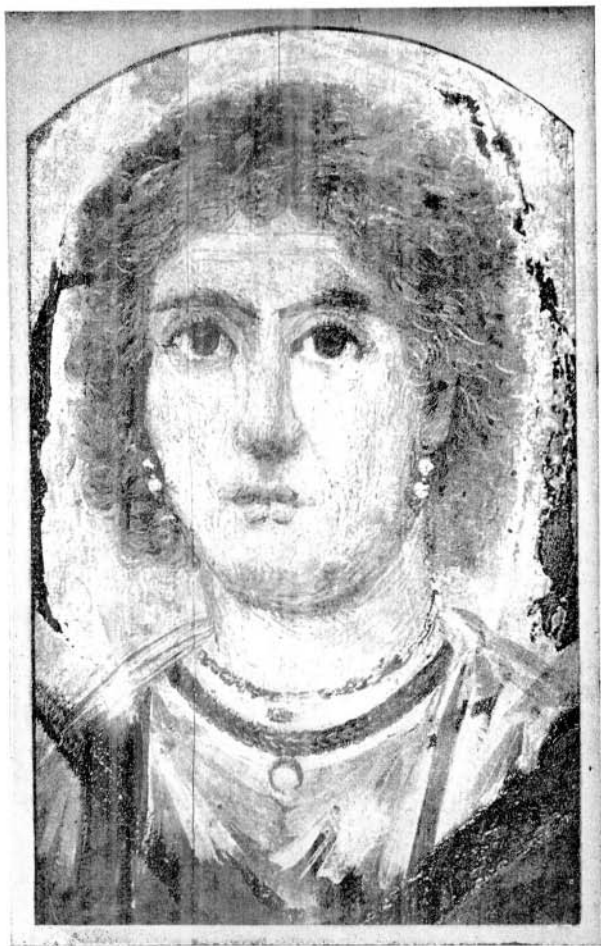
Hellenistisches Porträt aus Ägypten