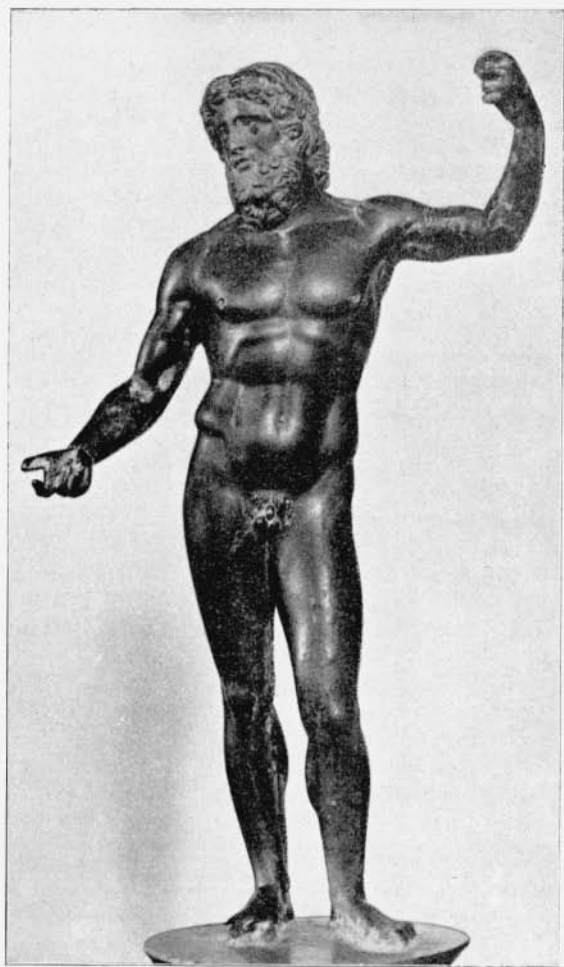
Zeusstatuette aus Bronze 373.