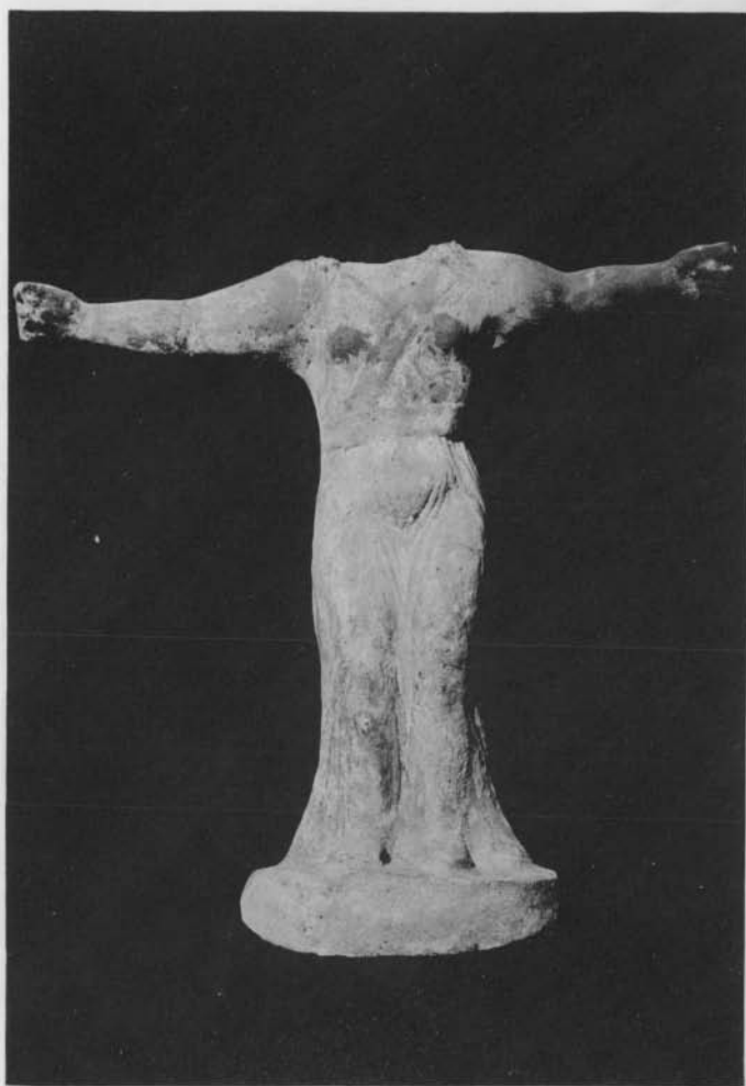
CARTHAGE. - FIGURINE EN TERRE CUITE.