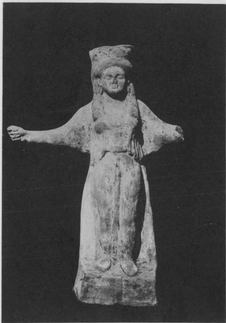
CARTHAGE. - FIGURINE EN TERRE CUITE.