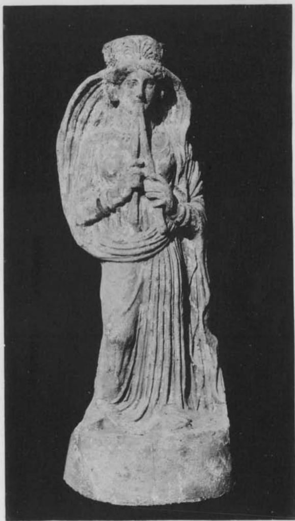
CARTHAGE. - JOUEUSE DE FLUTE EN TERRE CUITE.