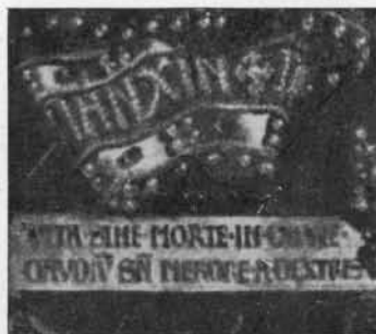
BORDURE DU MANTEAU DE JÉSUS-CHRIST, DANS LE « RETABLE DE L'AGNEAU ».