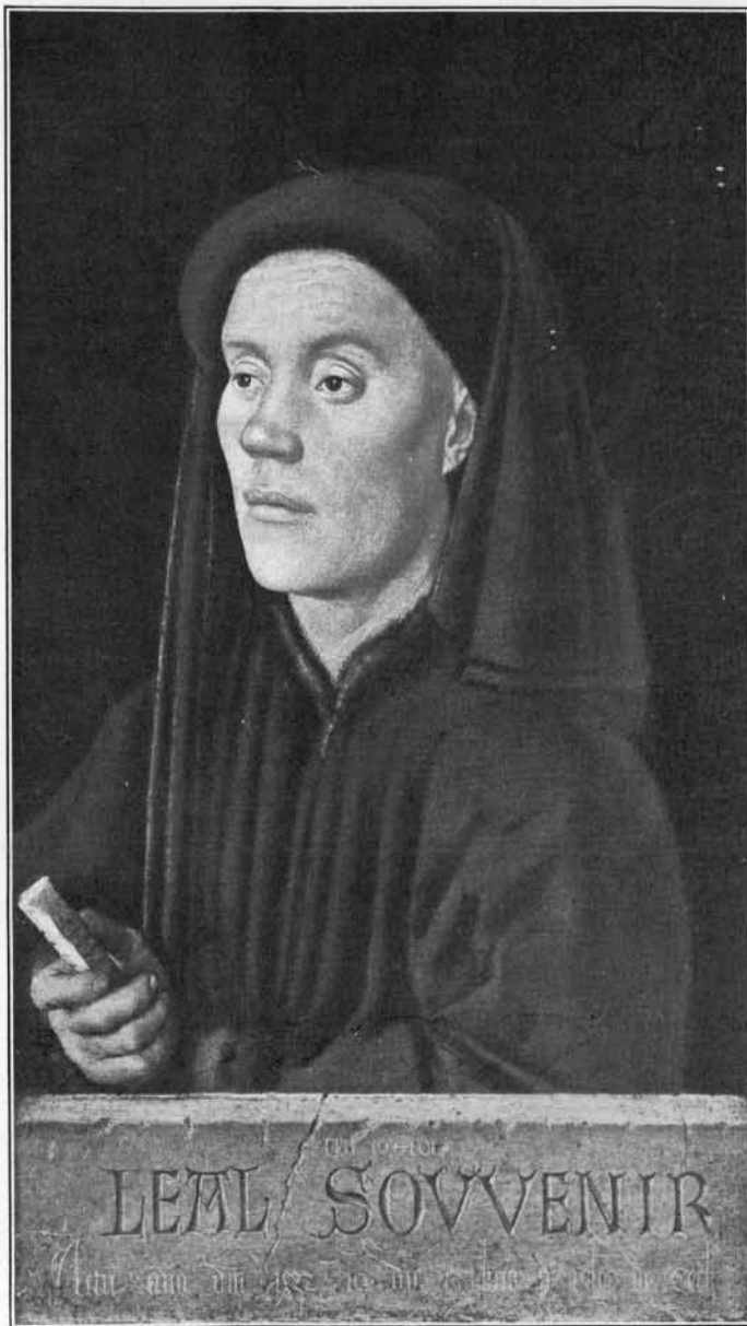
JEAN VAN EYCK. — PORTRAIT D'HOMME.

Et d'abord, je me laissais aller à remonter les âges. Je me rappelais