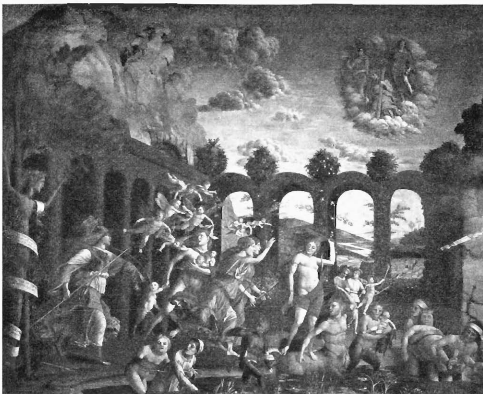
Abb. 2. Andrea Mantegna Die Austreibung der Laster Im Museum des Louvre zu Paris

Denn gerade dieses Bild hat man bisher mehr einer Bewunderung aus der Ferne als einer Untersuchung in der Nahe gewürdigt. 1) Völlig ging Fr. Schlegel (a. a. O. S. 13) in die Irre, wenn er in dem Bilde ein christliches Seitenstück zum Parnass, in Minerva, Diana und Castitas »heilige Frauen, die Priesterinnen der christlichen Dreyheit, des Glaubens, der Hoffnung und der Liebe, von Engeln begleitet«, erkennen wollte. Die Widerlegung ergibt sich aus dem, was wir zu sagen haben, von selbst. Wir beschränken uns auch hier auf das Notwendigste.