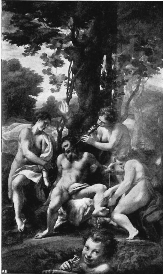
Abb. 6. Antonio Allegri da Correggio Die Bestrafung des Lasters Im Museum des Louvre zu Paris

erinnern in Einzelheiten des Ausdrucks und der Haltung Figur mit dem Kinde) an dieses Bild. Nur ist im Bilde Costas, wie der Mangel an Attributen zeigt, auf eine genauere Unterscheidung der Laster verzichtet. Dass aber das Reich, aus welchem sie ausgetrieben werden, dasselbe ist, wie in der Komposition von Peruzzi, nämlich der Parnass, scheint zweifellos. Wie dort Apollo mit den Musen, außerdem nur Minerva dargestellt ist, so ertönt hier Saitenspiel, welchem alles lauscht. Aber nicht nur ein Saitenspiel, das des Apollo und einer Muse, sondern auch ein zweites, vielleicht das des Orpheus, des Sohnes des Apollo und der Muse Kalliope, welche vielleicht in der zu seinen Füßen sitzenden Figur zu erkennen ist. So lenkt auch Arion und die klangreiche Schar von Wassergötter ihren Weg hierher. Aber auch Venus ist von dieser Versammlung nicht ausgeschlossen. Doch ist es die Venus caelestis, 1) welche, wie ihre Amoren, sitzsaam zuhört. Und so bietet auch die Gruppe des Dionysos und der schlafenden Ariadne das reinste Idyll, und Leda, wenn sie es ist, und nicht vielmehr etwa die Poesie, 2) kost in der unschuldigsten Weise mit dem Schwane. Wer aber