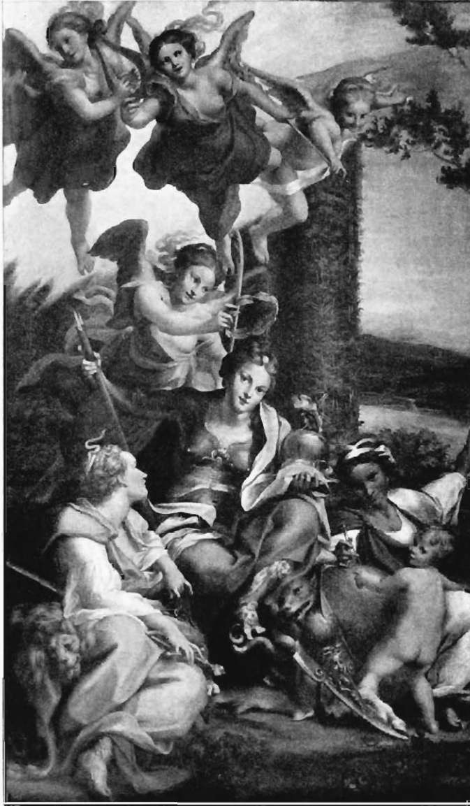
Abb. 7. Antonio Allegri da Correggio Die Belohnung der Tugend Im Museum des Louvre zu Paris

ist der schöne Jüngling mit Kranz und Fackel? Etwa Hymenäus? Aber um eine Hochzeit handelt es sich hier nicht. Sollen wir auf einen Namen ganz verzichten?