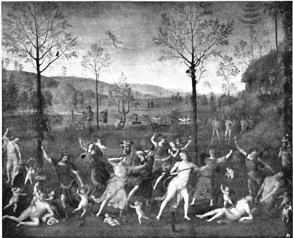
Abb. 3. Pietro Perugino Der Kampf der Keuschheit gegen die Sinnlichkeit Im Museum des Louvre zu Paris

ihn zum letzten raschen Abschluss trieb. Am 30. Juni 1505, also volle zwei Jahre nach dem vertragsmäßigen Termine, war das Bild im Studiolo angelangt. Aber nicht bloß über die Verzögerung war Isabella verstimmt. Sie missbilligte, dass er in Tempera gemalt hatte. Sie hatte gerade von ihm Ölmalerei, in der sich grössere Feinheit erzielen liefs, erwartet, während er um der Konformität mit Mantegna willen Tempera gewählt hatte. Auch in Bezug auf die Sorgfalt der Ausführung war sie nicht befriedigt.