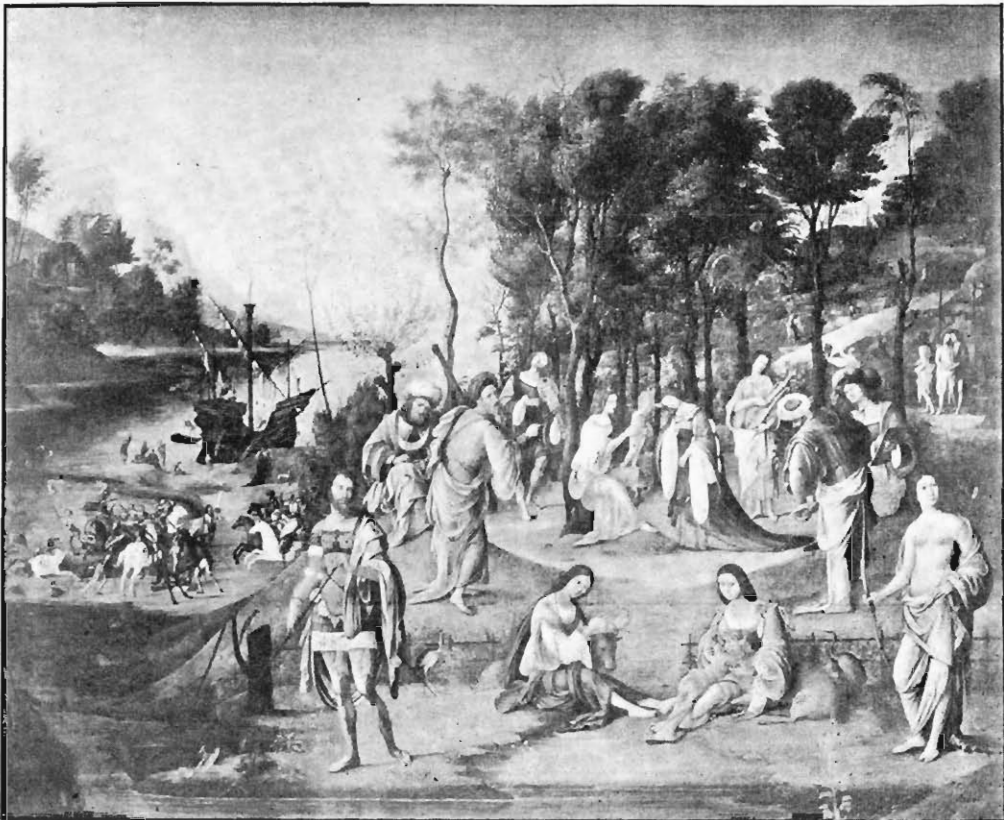
Abb. 4. Lorenzo Costa Der Musenhain der Isabella Gonzaga Im Museum des Louvre zu Paris

ging widerwillig an die Ausführung und arbeitete ohne Lust und Liebe, zuletzt eilte er nur um fertig zu werden. Das Urteil eines neueren Kunstgelehrten, 1) dass das Bild mehr einer leichten Skizze gleiche, ist freilich stark übertrieben; aber auch die Erwartung, welche der Abt Strozza der Bestellerin gegenüber aussprach, 2) dass »das Bild, wenn auch nicht zu den schönen und ausgezeichnetsten zu rechnen, doch sich würde unter den anderen sehen lassen können«, war nicht begründet. Isabella hatte Ursache etwas enttäuscht zu sein.