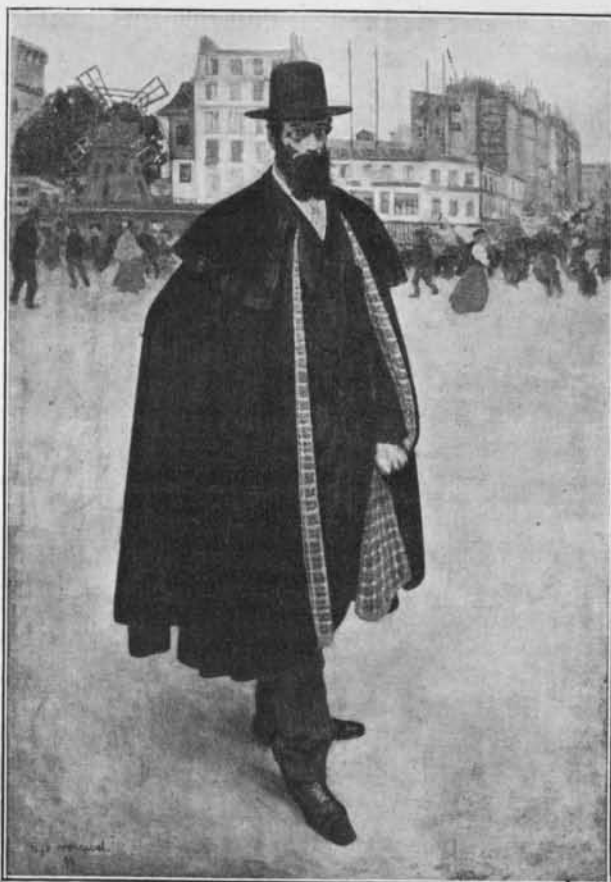
L'ESPAGNOL A PARIS, PAR H. EVENEPOEL (1899) (Musée de Gand.)