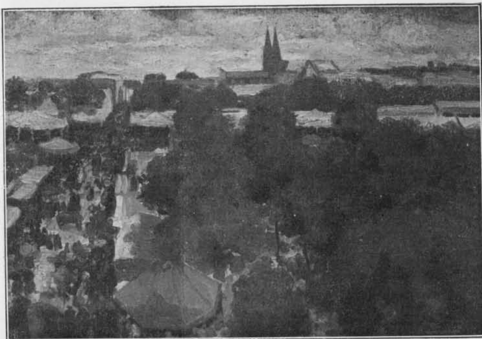
FOIRE DES INVALIDES, LE DIMANCHE, PAR H. EVENEPOEL

La route pour aller au Louvre ou à l'École est tout bonnement adorable ! Le matin c'est noyé dans la buée, à midi c'est éclatant de lumière, cela poudroie, et à 6 heures c'est d'une coloration superbe et vigoureuse.... Eh bien ! toute cette route est pour moi l'objet d'une attention constante. Je peins par les yeux constamment (c'est une manière comme une autre de ne pas faire de croûtes !) ...Et le jardin des Tuileries maintenant est absolument admirable ; les lilas en fleurs répandant des senteurs exquis, et un bain de lumière sur les feuilles nouvellement écloses des grands arbres séculaires, et des bonnes à tabliers blancs, bleus dans l'ombre, et des dames en deuil, bleues à contre-jour des pieds à la tête, et les robes bariolées des jeunes femmes,