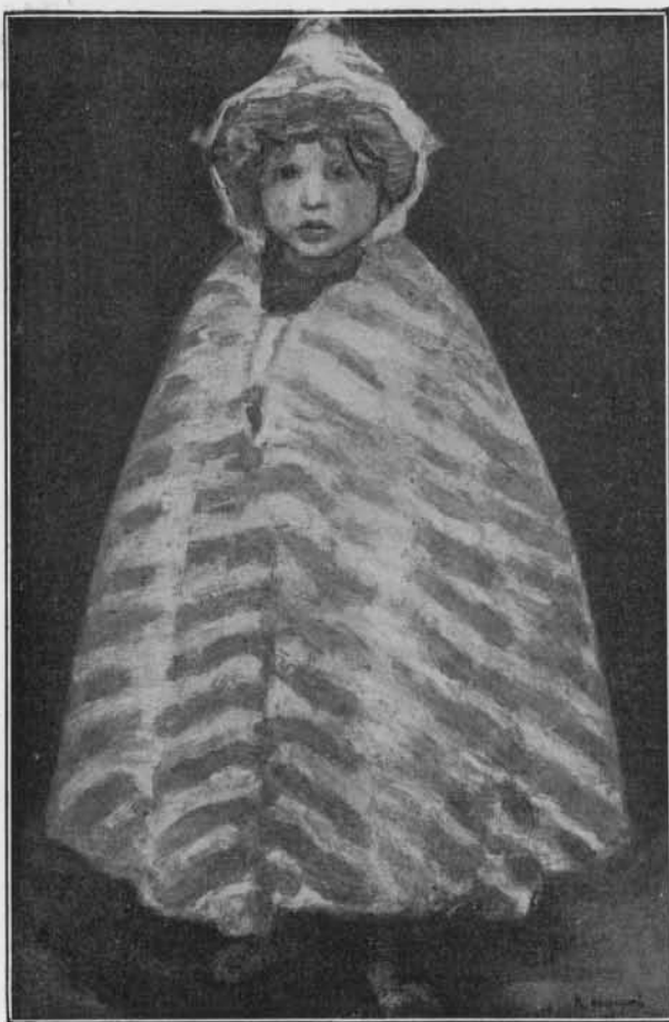
CHARLES EN ARABE, PAR H. EVENEPOEL (1898)

J'ai pu juger hélas du pompiérisme de tous ces braves gens ici. Ils n'aiment