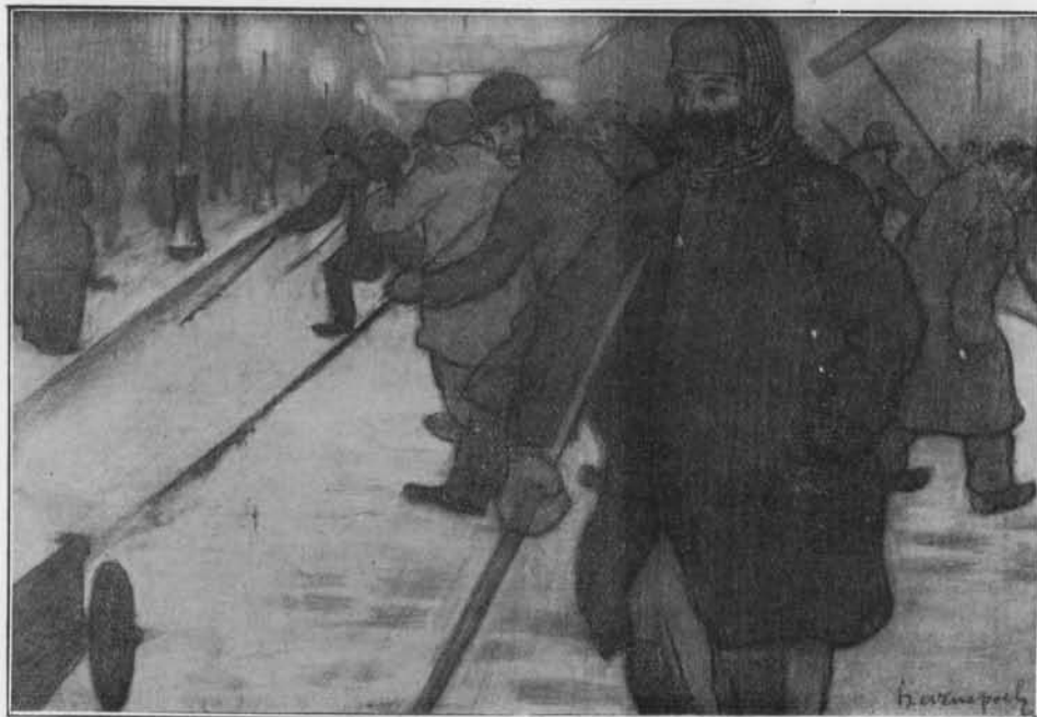
LA NEIGE, DESSIN PAR EVENEPOEL

Je crois que j'arrive à la période la plus heureuse de ma vie et à celle où j'éprouverai le plus vivement les impressions. Car ici tout dans ce milieu est là pour vous les donner. A peine sort-on de la porte que se dresse la Seine avec ses grands ponts, ses brouillards, ses silhouettes du Louvre, de la Sainte-Chapelle, de Notre-Dame,