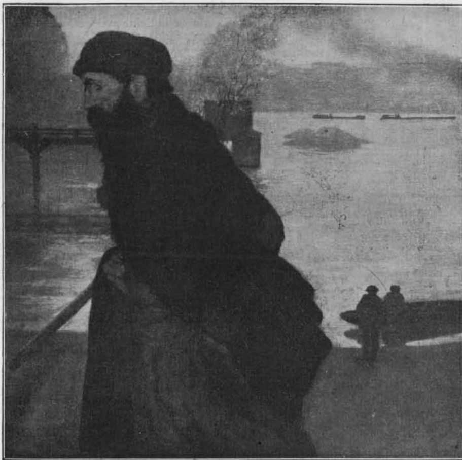
OUVRIER DE LA SEINE, PAR H. EVENEPOEL (1896)

reste bien loin de la famille à tous ceux qui peinent et luttent; l'œuvre d'Evenepoel dénote un étrange intérêt pour le monde du travail, pour le peuple. Il ne le flatte pas; sans doute il en sourit quelquefois, mais jamais on ne sent chez lui le côté amer et sarcastique d'un Toulouse-Lautrec, qu'il admirait beaucoup cependant. Il faudrait pouvoir citer les pages émues