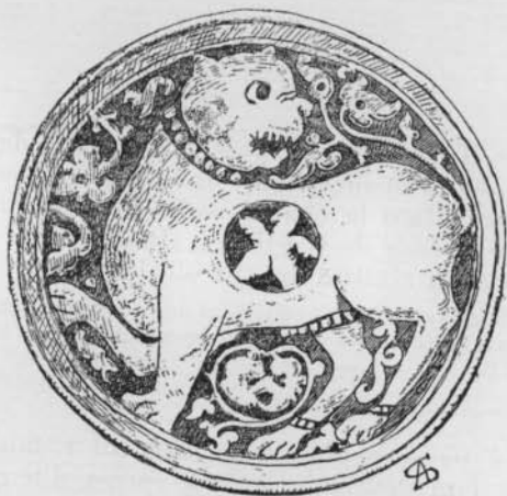
FIG. 6 (N° 13)