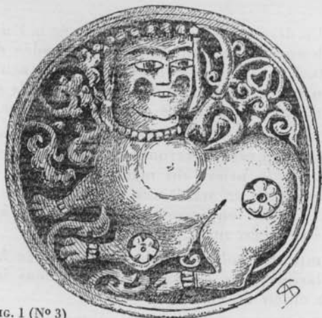
FIG. 1 (N° 3)