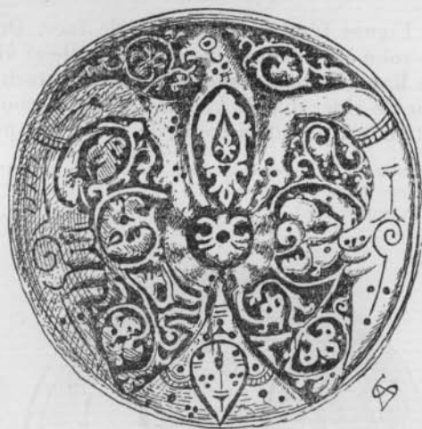
FIG. 4 (N o 8)