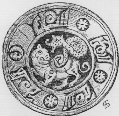
FIG. 7 (N o 18)

19. — COUPE PROFONDE. — Au pourtour, inscription coufique stylisée.