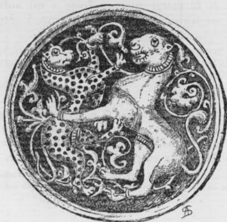
FIG. 5 (N o 9)