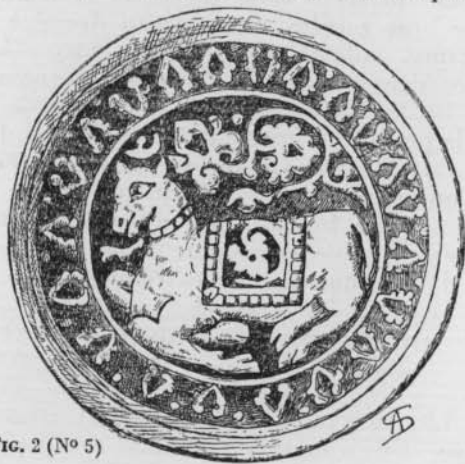
FIG. 2 (N° 5)

FOUILLES DE SENDJAN. — Terre rouge, à dessin en léger relief et gravé, couverte d'émail vert émeraude. (Diam. 0,195 ; prof. 0,09.) Voir la reproduction Pl. III