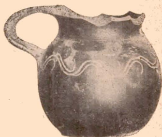
Fig. 20 (25).

24 (866) OEnoché à panse aplatie. Haut. : 0 m. 108. — Fig. 19.