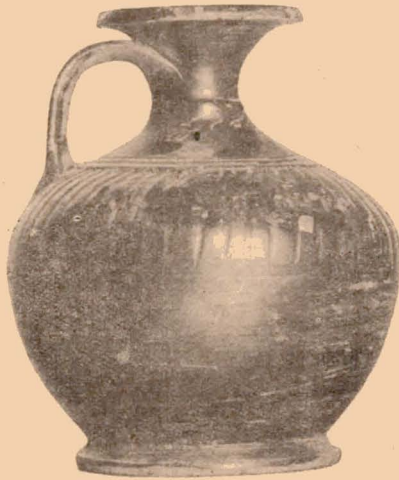
Fig. 18 (23).

Vase recouvert de vernis noir brunâtre sauf le fond qui est seulement orné d'un cercle avec point central.