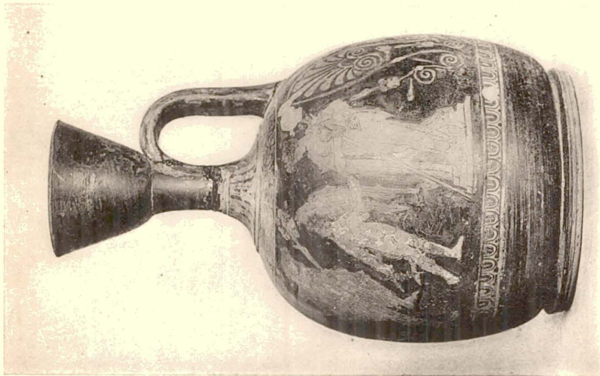
Lécythe aryballisque (Tégée).