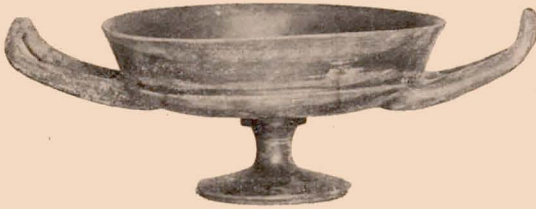
Fig. 23 (28).

28 (861). Coupe à rebord vertical et à anses recourbées. Haut. : 0 m. 064 ; diam. (sans les anses) : 0 m. 127. — Fig. 23.