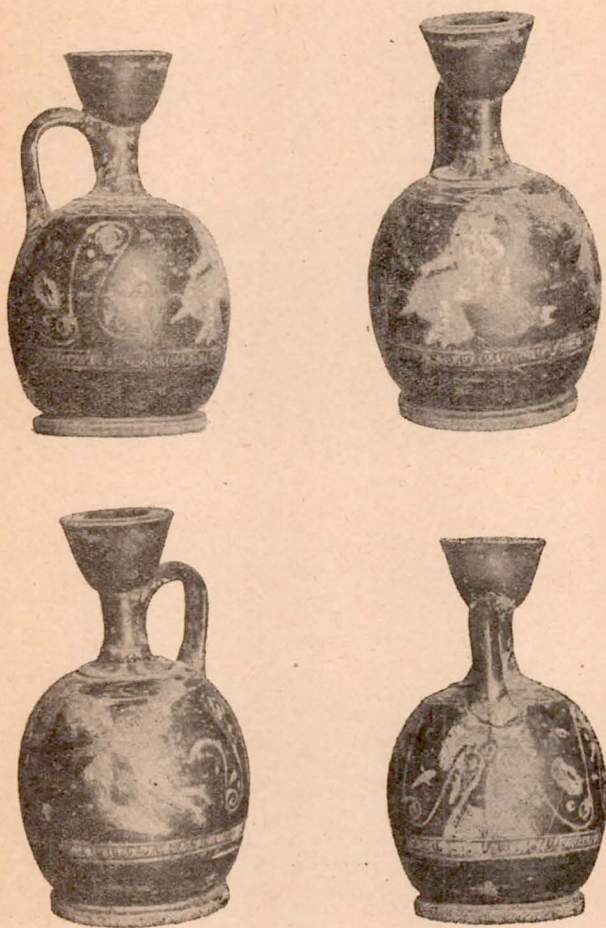
Fig. 1 (2).

aux autres figures, elles se retrouvent sur les vases meidiésques : l'Eros attrapant un lièvre sur l'hydrie de Populonia (1), le Dionysos appuyé sur le genou sur l'hydrie de Londres où Klytios est représenté avec la même attitude (2) ainsi que sur la belle coupe de la collection Mouret (3). Le dessin des