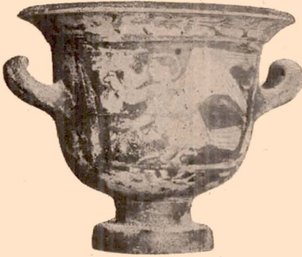
Fig. 7 (10).

drapée, tenant un rinceau, qui passe à g. en retournant la tête. Sous les anses, grandes palmettes accostées de rinceaux. Au-dessous, autour de la base, large bande couleur de l'argile. A l'intérieur, vernis noir. Manquent les anses.