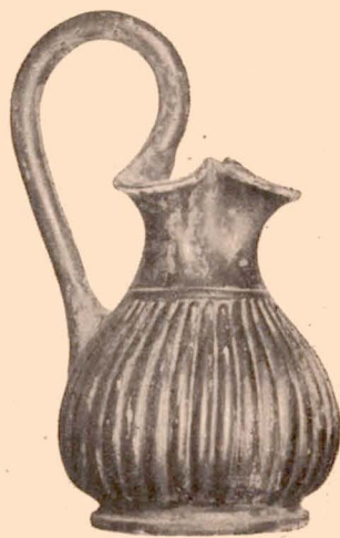
Fig. 22 (27).