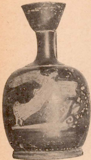
Fig. 5 (7).

Un ressaut sépare le col de l'épaule. Sur la panse, femme drapée volant en tenant un coffret (1); au devant, rinceau. Aucun décor sur la face postérieure.