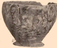
Fig. 9 (13).

Autour du bord, deux séries horizontales de points superposés. Au-dessous, d'un côté, personnage peu distinct (homme ?), passant à dr. en retournant la tête; de l'autre, personnage aussi peu distinct, passant à dr. en tendant le corps en avant. Sous les anses, palmettes accostées de rinceaux. A l'intérieur, vernis noir.