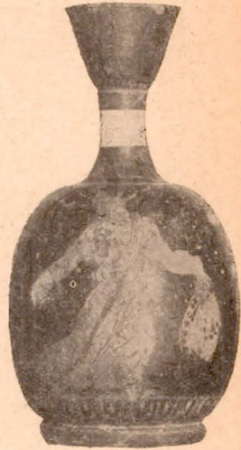
Fig. 4 (6).