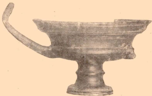
Fig. 13 (17).

Vase entièrement recouvert de vernis noir, sauf le dessous qui est resté couleur de l'argile.