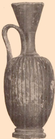
Fig. 21 (26).

Anneau saillant autour du col. Le vase est recouvert de vernis noir sauf le bas de la panse et le dessous. Exécution négligée; vernis appliqué sans soin.