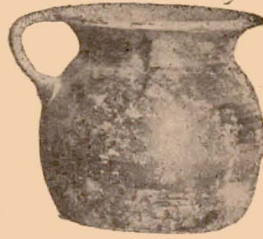
Fig. 17 (22).

22 (873). Vase à une anse verticale. Haut. : 0 m. 078. — Fig. 17.