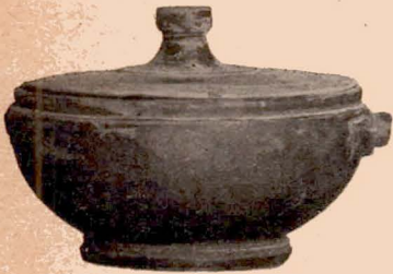
Fig. 11 (15).

Le vase et son couvercle sont recouverts, intérieur et extérieur, de vernis noir à l'exception du dessous du pied où sont simplement peints deux cercles noirs. Plusieurs cordons saillants circulaires entourent le bouton et le dessus du couvercle.