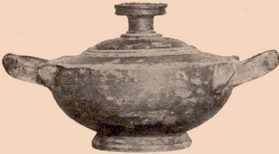
Fig. 10 (14).

14 (869). Pyxis à anses horizontales, avec son couvercle (1). Haut. (avec le couvercle) : 0 m. 095 ; diam. (sans les anses) : 0 m. 12. — Fig. 10.