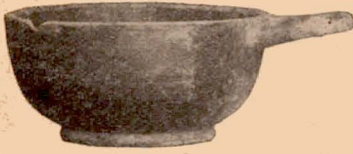
Fig. 16 (21).

Vase recouvert de vernis noir sauf le dessous.