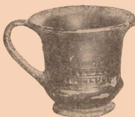
Fig. 25 (31).

Vase très endommagé auquel manquent le pied et la plus grande partie de l'anse. Il est recouvert de vernis noir. A l'intérieur, le fond portait un décor estampé, formé par quatre motifs disposés autour d'un motif central, dont il n'est plus possible de distinguer la nature exacte.