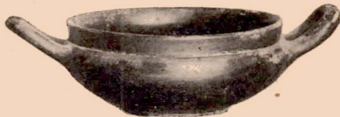
Fig. 12 (16).

15 (864). Pyxis à anses horizontales, avec son couvercle. Haut. (avec le couvercle) : 0 m. 077 ; diam. : 0 m. 095. — Fig. 11.