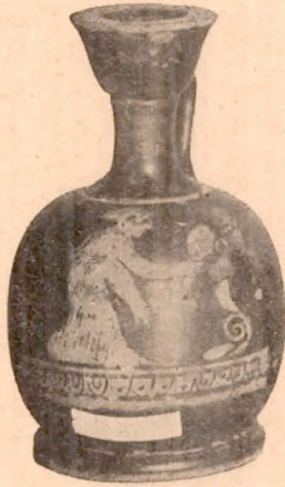
Fig. 3 (5).

Un ressaut sépare le col de l'épaule. Sur la panse, femme drapée tenant un miroir ; devant elle, rinceau ; au-dessous, ovès. Aucun décor sur la face postérieure.