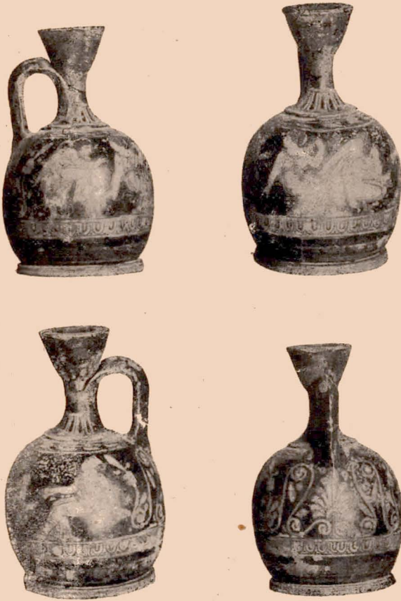
Fig. 2 (4).

assise, vêtue d'une draperie transparente; 2. un Eros agenouillé devant elle; 3. une femme assise, également vêtue d'une draperie transparente; 4. un homme appuyé sur un bâton et causant avec elle; sa draperie est rejetée sur le côté g. de façon à laisser le côté dr. entièrement dévêtu; son chapeau de voyage pend par derrière; sa jambe g. est relevée et posée