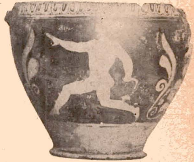
Fig. 8 (11).