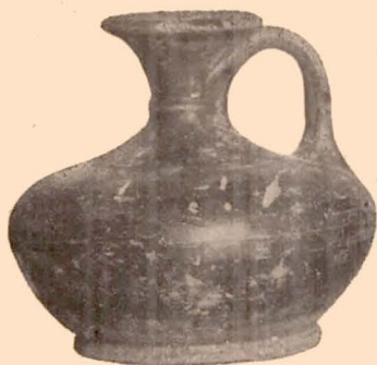
Fig. 19 (24).

Trois ressauts séparent le col de l'épaule. Sur l'épaule, sillons verticaux peu profonds. Le vase est, sauf le dessous, recouvert de vernis noir.