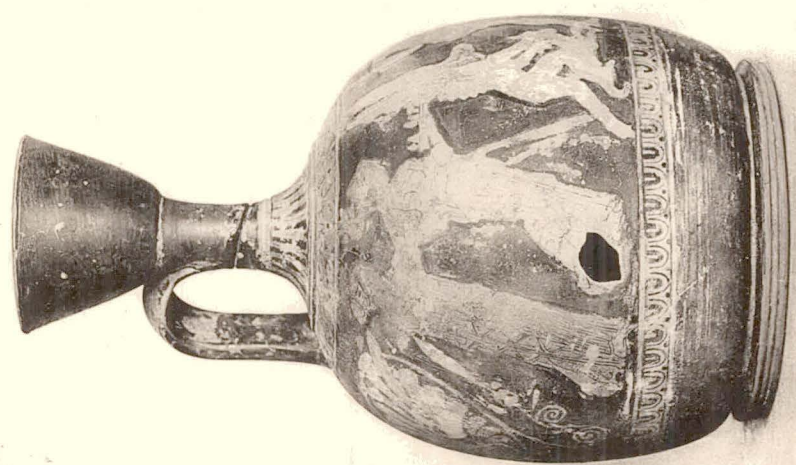
Lécythe aryballisque (Tégée).