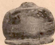
Fig. 6 (8).

Manque le col. Peinture très endommagée et, d'ailleurs, peu soignée.