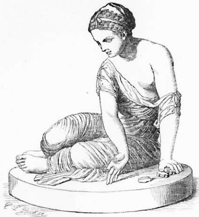
Ἄμφ' ἀστραγάλοις χολωθείς —