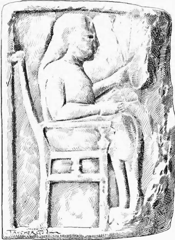
Bas-relief de Paros (collection Max Klinger, à Leipzig).

Ce dernier trouve donc sa place dans une série déjà constituée, celle des ex-voto au mort héroïsé, et rien, croyons-nous, ne dément