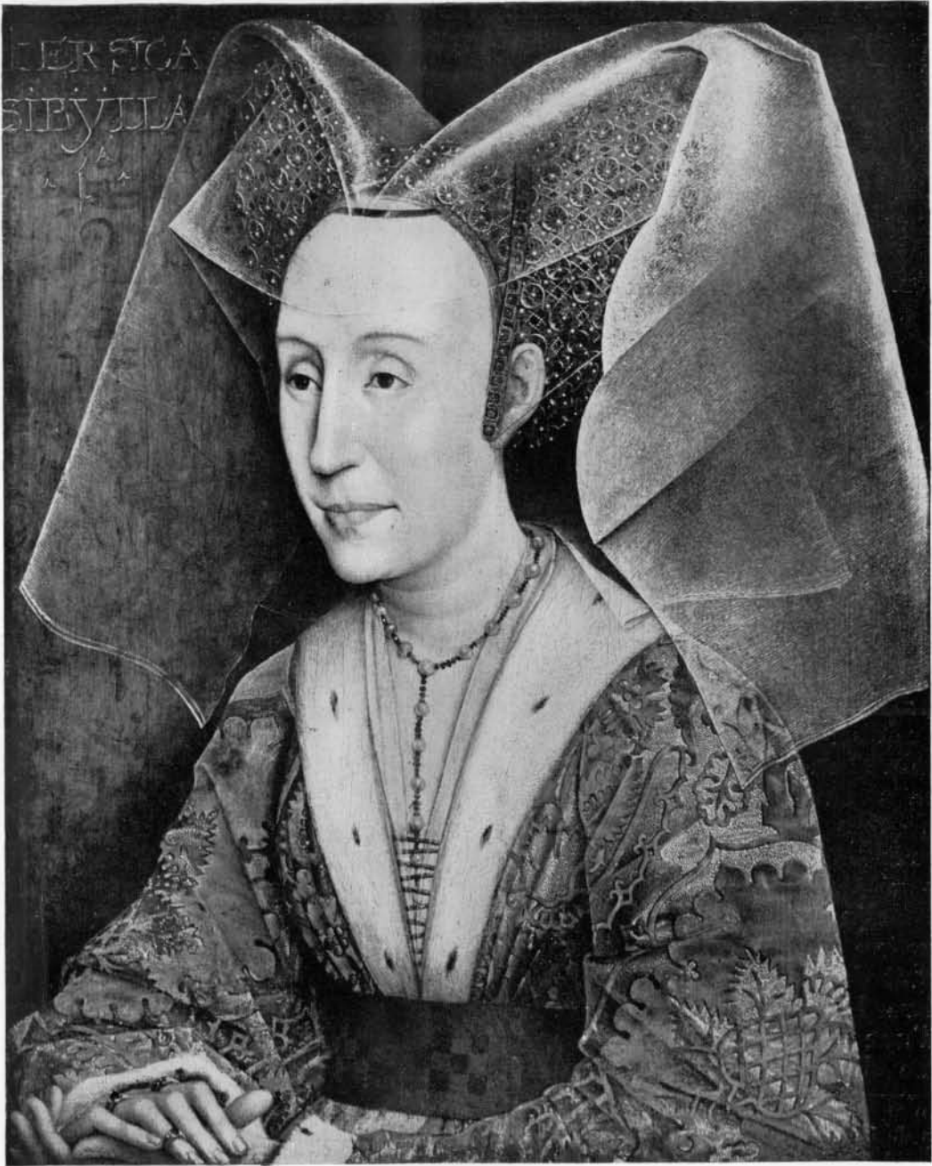
Fig. 4. ROGER VAN DER WEYDEN: ISABELLE DE PORTUGAL, DUCHESSE DE BOURGOGNE. COLL. JOHN D. ROCKEFELLER.