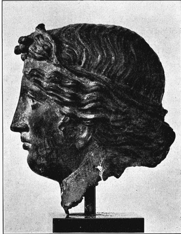
Abb. 6. Kopf des Dionysos in Berlin.

wäre, auch hier die Frage nach einem bestimmten Vorbilde aufzuwerfen. Das Gesicht der Göttin ist in großen, flächenhaften, aus der Entfernung sehr wirksamen Formen gehalten; die Stirn ist ungliedert, die Augenbrauen über den flachgeschwungenen Brauenbogen nicht plastisch angegeben. Die mitgegossenen, nicht eingesetzten flachen Augen mit den nach jüngerer Sitte vertieften Sternen blicken groß aus den weit geöffneten Lidern, von denen das obere etwas überhängt, das untere ganz schmal gehalten ist und sich scharf von der Wange absetzt. Die Nase, durch die häßliche Ergänzung sehr entstellt, hat einen breiten scharfkantigen Rücken und tiefe Flanken, die ohne weiche Übergänge knapp zu den Wangen überleiten; die Nüstern sind schmal und wie vom heftigen Atmen infolge der schnellen Bewegung gebläht. Der Mund ist fast puppenhaft klein, doch voll in seinen Formen, das Kinn gerundet. Tiefere seelische Belebung mangelt diesem Antlitz, nur die aufgerichtete Haltung des ganzen Kopfes verleiht ihm den Ausdruck von Stolz und Hoheit. Die Bildung von Stirn, Augen und Wangen erinnert an die typischen Züge der argivischen Köpfe, und von der Seite