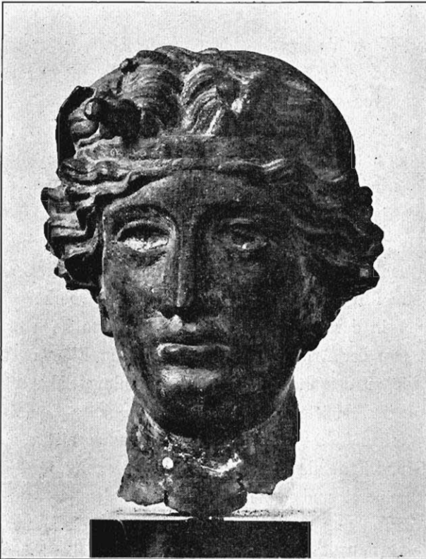
Abb. 5. Kopf des Dionysos in Berlin.

Endlich kam die Mänade der Umbildung zur Victoria darin entgegen, daß nach dem Vorbilde des Neapler Dionysos ihr linkes Bein frei aus dem Gewande hervortritt,