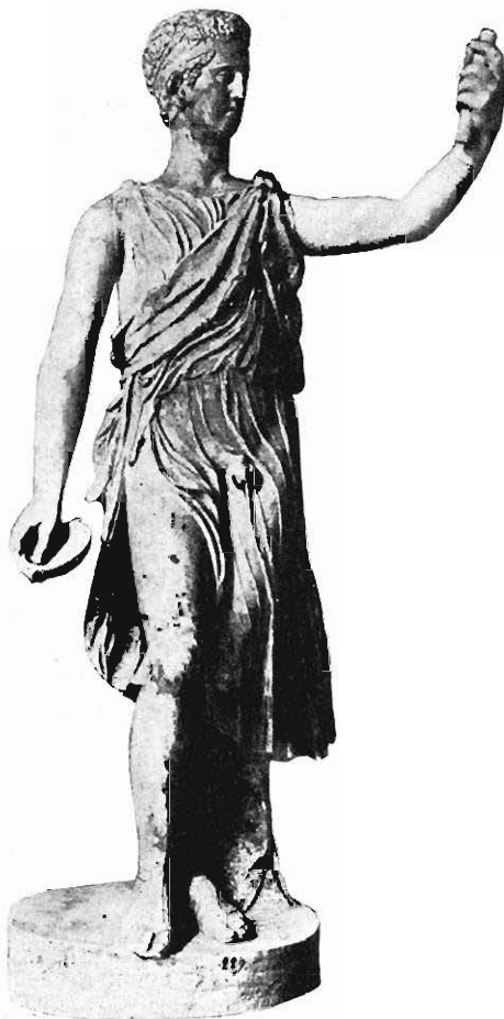
Abb. 1. Dionysos in Neapel.

fahren, das nicht ohne Beispiele ist (Furtwängler, Über Statuenkopien im Altertum S. 30; Watzinger, Magnesia S. 225, Nr. 9); dann hat er das bei der Mänade