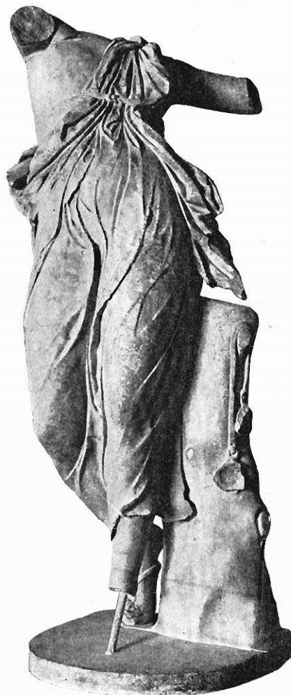
Abb. 2. Mänade in Berlin.

Aus dieser Ableitung von dem Typus einer tanzenden Maenade erklärt es sich, daß die Viktoria in der Seitenansicht immer unerfreulich wirkt. Trotz der Beflügelung und der Kugel fliegt die Göttin nicht; es bleibt immer das tänzelnde Hüpfen, fast peinlich für uns, denen bei dem Wort Nike gleich das Werk des Paionios oder die samothrakische Göttin in den Sinn kommen. Doch wird man den Römer gern entschuldigen, wenn man sich erinnert, daß außer den Laren auch verwandte Gottheiten