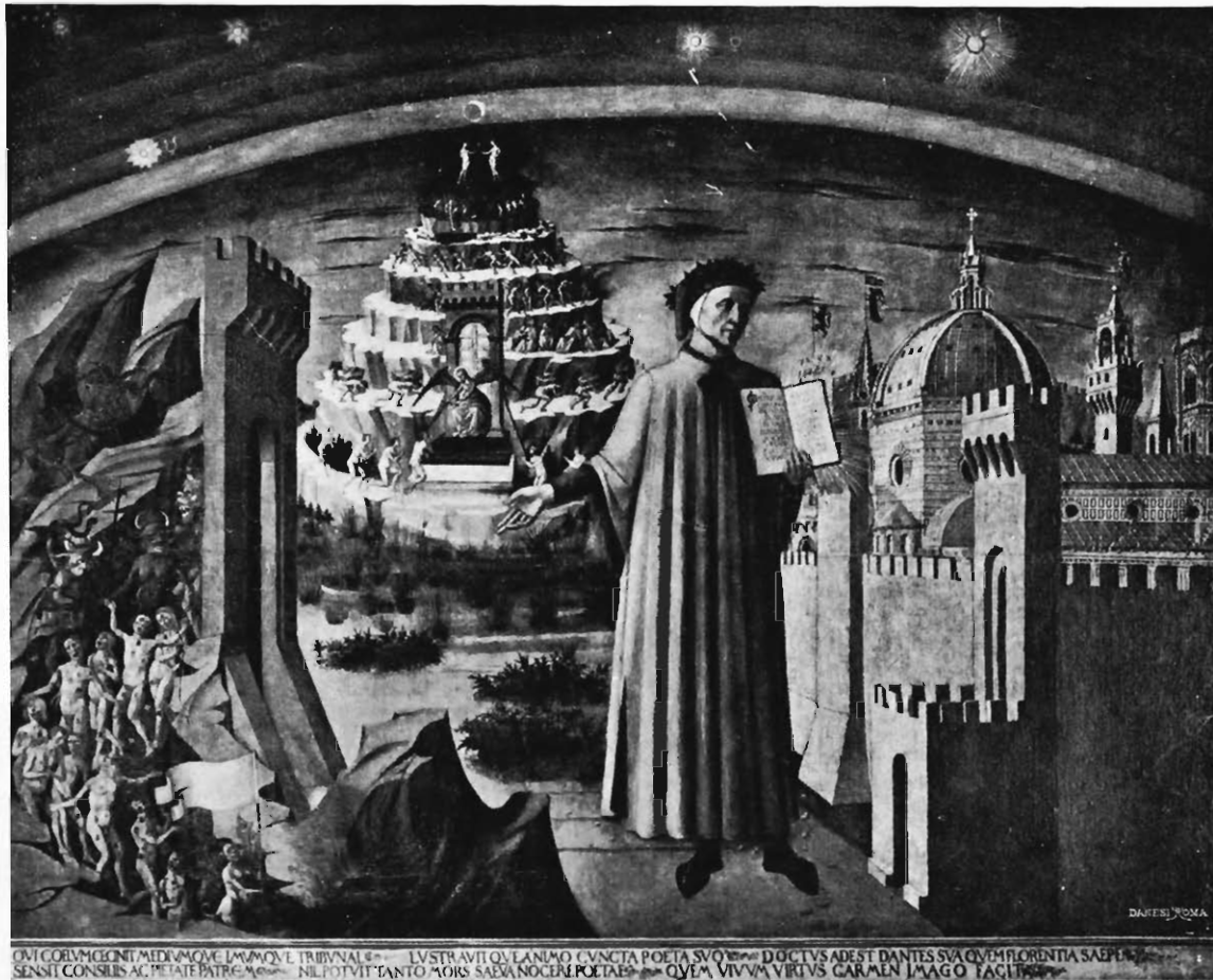
Domenico di Francesco detto Michelino: Dante e il suo poema Firenze, Cattedrale

È probabile che Francesco Talenti, adottando questi contrafforti, avesse il progetto di sormontare la sua facciata con un coronamento tricuspidale. Questi contrafforti, se non sono una prova assoluta di questa intenzione, ne sono almeno una prova probabile. L'affresco del Cappellone degli Spagnuoli, fatto dopo il 1355, ci mostra la Cattedrale di Firenze terminata da una facciata tricuspidale. Se questo affresco non riproduce il progetto di Francesco Talenti,