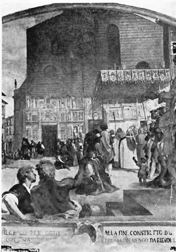
Poccetti: Sant'Antonino prende possesso della cattedrale fiorentina. Firenze, R. Museo di S. Marco

Arnolfo che viveva alla fine del secolo XIII, nonostante l'introduzione delle novità gotiche, prima che le facciate di Siena e di Orvieto fossero state cominciate, aveva dovuto, a mio avviso, concepire la facciata della Cattedrale di Firenze nella forma tradizionale delle facciate