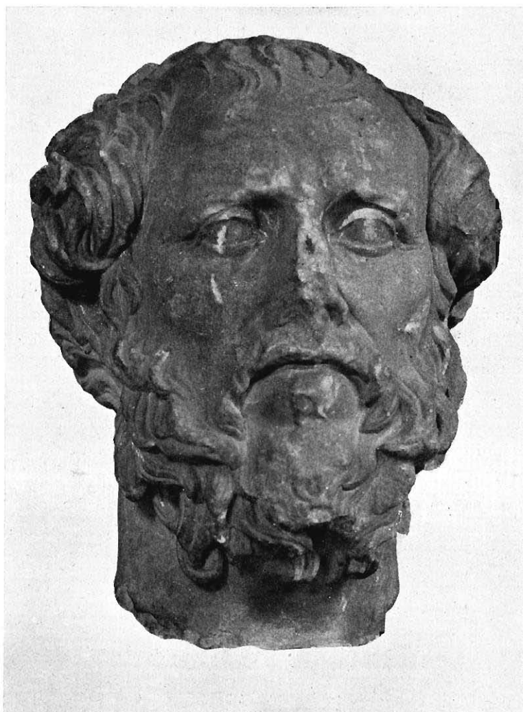
Fig. 1. Testa del Museo Civico di Bologna.

bolognese e quella del rilievo, presentano forti somiglianze accentuate dal fatto che in ambedue è lo stesso corrugamento delle sopracciglia, causato nella testa bolognese