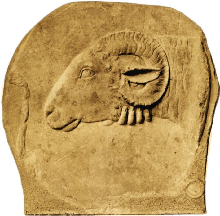
RELIEF IM MUSEO CIVICO ZU BOLOGNA.