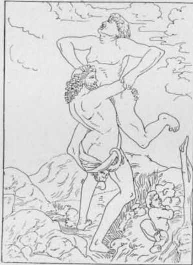
Fig. 7. — Hercule et Antée, par Robetta, d'après Pollainolo (Crattwell, p. 74).

Le tableau, provenant de la collection de François I er , existait encore à Fontainebleau au xvii e siècle. On nous dit que l'exécution en était très soignée, mais un peu sèche. Cassiano del Pozzo, qui visita Fontainebleau en 1625, écrit que la figure de la déesse,