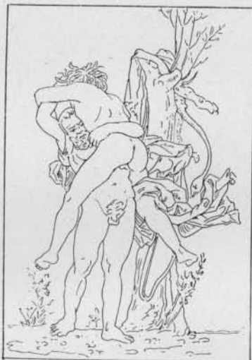
Fig. 3. — Hercule et Antée, d'après Mantegna (Kristeller, p. 410).

Exceptionnellement (fig. 2), Antée écarte un de ses bras le long de son corps, soit pour se donner de l'air, soit pour essayer de toucher le sol réparateur ( nitentem in terras iuuenem , dit Lucain) 2 . Jamais il ne lève les bras au ciel 3 . Pollaiuolo, Mantegna et leurs élèves ou imitateurs, comme l'Allemand Baldung Grien 4 , fournissent la preuve de ce que je viens d'avancer. Antée n'a d'ailleurs aucune raison de lever au ciel les deux bras ou même un bras, car, d'abord, ce n'est pas du ciel qu'il peut attendre du secours, mais de la terre; ensuite, dans le désert où la scène se passe, il ne peut appeler personne à son aide; enfin, il n'a pas trop de ses bras pour se défendre contre l'étreinte du héros. Au