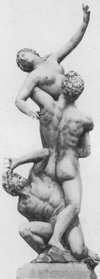
Fig. 10. — L'Enlèvement de la Sabine, par Jean de Boulogne (Loggia dei Lanzi à Florence).

est si peu connu qu'il serait presque inintelligible. Le titre de l'Enlèvement des Sabines , au contraire, répond à toutes les convenances. Ce jeune homme, c'est un Romain ; c'est Thalassius à qui ses soldats donnèrent,