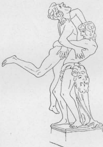
Fig. 5. — Hercule et Antée, d'après Pollaiuolo (Cruftwell, p. 81).

Remarquons d'abord que la ligne elliptique, tracée autour des pieds des personnages, n'est pas une ligne de terre, mais évidemment le contour d'une petite base circulaire, d'un piédestal. Il en résulte que le croquis — ou le modèle de ce croquis — a été exécuté d'après une maquette, probablement de terre cuite. Nous possédons un texte de Vasari, fort bien