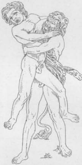
Fig. 6. — Hercule et Antée, d'après Pollaiuolo ( L'art pour tous ).

Dans la page du manuscrit du Vatican où figure ce croquis, il est question d'Hercule et d'Antée à propos de l'équilibre d'un corps chargé d'un fardeau 2 . Rien n'est donc, au premier abord, plus séduisant que de voir ici une représentation de cet épisode, d'autant plus que la poitrine du personnage soulevé de terre est