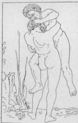
Fig. 1. — Hercule et Antée, d'après Mantegna (Kristeller, Mantegna , p. 390).

La victoire d'Hercule sur le géant de Libye a été représentée