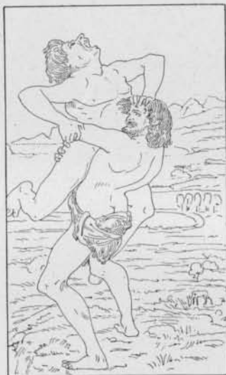
Fig. 4. — Hercule et Antée, d'après Pollaiuolo (Cruftwell, p. 70).

Cela posé, je vais parler d'un manuscrit du Traité de la Peinture de Léonard de Vinci, con-