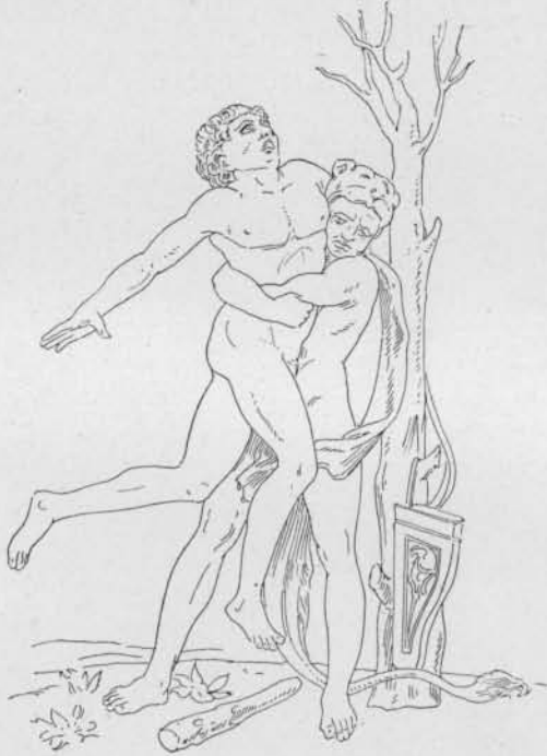
Fig. 2. — Hercule et Antée, d'après Mantegna ( L'art pour tous ).

Les artistes italiens du xv e siècle ont souvent figuré la lutte d'Hercule et d'Antée, en se conformant au motif suggéré par la description de Lucaïn ; ils y ont été sans doute encouragés par la découverte d'œuvres antiques, reliefs de sarcophages et sculp-