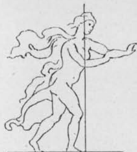
Fig. 9. — Femme courant, de l'école de Léonard de Vinci (Müntz, p. 238).

du manuscrit du Traité de la Peinture , aujourd'hui, comme nous l'avons dit, au Vatican 1 . Comme, sur le carton, Proserpine était figurée toute nue un marquis de Melzi fut pris de scrupules et abandonna le malheureux dessin à son confesseur, qui le jeta au feu. C'est ce que raconta, en 1804, le savant Amoretti, d'après les notes manuscrites du chevalier de Pagave 2 . « Trovo nelle note inedite del De Pagave che alcuni disegni in grande di donne e divinità ignude, come di Proserpina rapita da Plutone... possedeva il