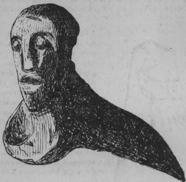
Fig. 5. — Masque humain, sculpté sur la tête d'un fémur de bovidé, provenant d'un gisement néolithique de la Marne.

humaine (fig. 5), trouvée sur les bords de la Marne, dans un milieu néolithique. Et il est impossible de ne pas remarquer