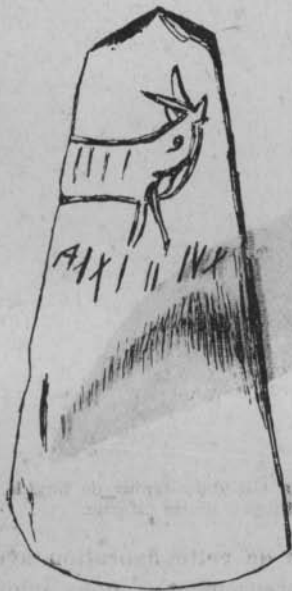
Fig. 6. — Hache polie de Radasen, actuellement au musée de Folticeni.

Me sera-t-il permis, je l'espère, de rattacher tous ces faits à l'inexistence du hiatus, fait démontré depuis longtemps, mais, bien plus que cela, à une continuité et à une connexion du paléolithique au néolithique , de toute autre façon qu'elles ne furent considérées jusqu'à présent.