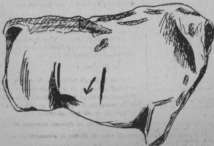
Fig. 2. — Bison sculpté d'Isturitz, portant une flèche gravée sur son flanc.

Au milieu du flanc droit, nous dit de Saint-Périer, on remarque une entaille verticale, qui a entamé profondément le grès... derrière l'entaille, l'artiste a gravé une flèche à pointe bifide (fig. 2).