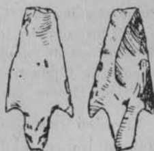
Fig. 4. — Pointe de flèche solutréenne. Cueva del Serron.

Mais voici que Louis Siret (13) en décrit une en silex (fig. 4) recueillie à la Cueva del Serron , dans un milieu solutréen non remanié. C'est « une pointe de flèche à pédoncule et deux barbelures symétriques ».