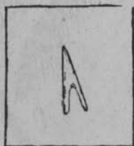
Fig. 3. — La Madeleine. Pointe de flèche en os.