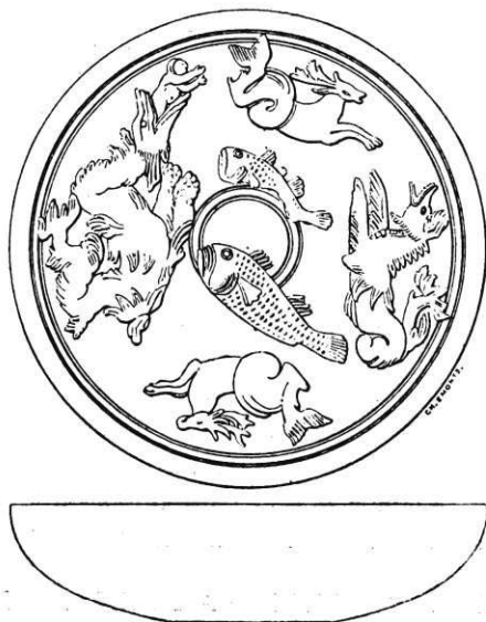
Écuelle de terre rouge trouvée à El-Aouja (Tunisie).

c. Écuelle mesurant 0 m. 172 de diamètre, 0 m. 0435 de hauteur, brisée en plusieurs morceaux se raccordant et presque com-