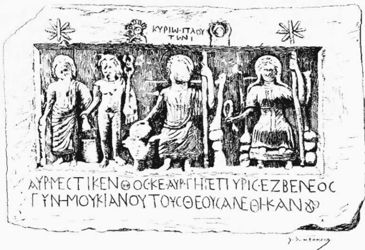
RELIEF VOTIF TROUVÉ A NICOPOLIS.

Plaque épaisse, en marbre blanc, apportée, il y a une quinzaine d'années, d'Hisarlik à Serrès, dans la maison Καπέτης (consulat de Grèce). Elle a été décrite d'une façon erronée par M. Papageorgios dans le magazine athénien 'Εστία, 1893, p. 158 (cf. du même Αἱ Σέρραι, p. 11, et Wochenschr. f. kl. Phil. , 1893, col. 392) : description reproduite dans Ath. Mitth. , 1893, p. 70 (d'où Drexler, Lexicon de Roscher, II, col. 1762, et S. Reinach, Chron. d'Orient , II, p. 242), et dans Dimitzas, 'Η Μακεδονία ἐν λίθοις, p. 669.