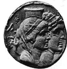
Fig. 28 Münze Alexander I. Balas und der Kleopatra.