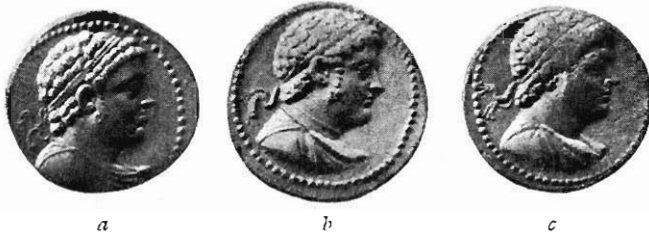
Fig. 25 Münzen Ptolemaios IV Philopator.

Nicht nur die individuellen Züge des feisten Gesichtes mit der unbedeutenden Nase, die in ihrem unteren Drittel das Vorspringen noch besonders accentuiert, sondern noch entscheidender die „whiskers“, das Backenbärtchen, das bei den Griechen nur bis ins fünfte Jahrhundert hinein allgemein Mode war, erweisen, daß hier ein Porträt vorliegt, und zwar wegen der Flügel über der Stirne ein Porträt als Hermes. Die Apotheose allein schon läßt nicht zunächst an einen