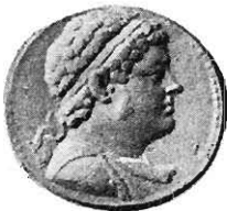
Fig. 26 Münze Ptolemaios IV Philopator.

lichkeit mit den Münzporträts die in der Büste dargestellte Persönlichkeit als Ptolemaios IV Philopator erkennen müssen. Man vergleiche sein mit nicht so starken Varianten als üblich auf den Münzen festgehaltenes Bildnis in dem Brit. Mus. Cat. Ptolemies pl. XIV 6—7, 9—10 (Fig. 25 a und c) XV 1—2 (Fig. 25 b); auch bei Imhoof-Blumer, Griechische Porträtköpfe Taf. VIII 8 und 9 (Fig. 26 und 27); am ausführlichsten sind jetzt diese Münzen mitgeteilt von Σβορώνος, Νομίσματα τῶν Πτολεμαίων I. Taf. 371; 42, 43. Die namentlich auf den größer aus-