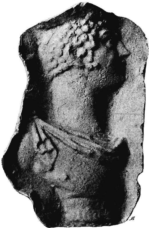
Fig. 24 Gußform im Museum zu Kairo.

Im Katalog der griechischen Gußformen im Museum zu Kairo, den wir C. C. Edgar 1) verdanken, fiel mir ein Stück auf, das uns bei genauerem Zusehen mehr Aufschlüsse gibt, als es nach der genannten Beschreibung scheinen könnte.