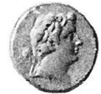
Fig. 27 Münze Ptolemaios IV Philopator

geführten Stempeln sehr individuellen Züge, die eher einem schwäbischen Bauern als einem ägyptischen König anstünden, haben etwas für einen Griechen so außergewöhnliches, daß die Identification als zweifellos betrachtet werden darf. Der einzige Unterschied, der aber bei der schlagenden Übereinstimmung so vieler anderer Züge nichts zu bedeuten hat, tritt in der Länge des Halses hervor, welche in der Büste übrigens auch der Natur