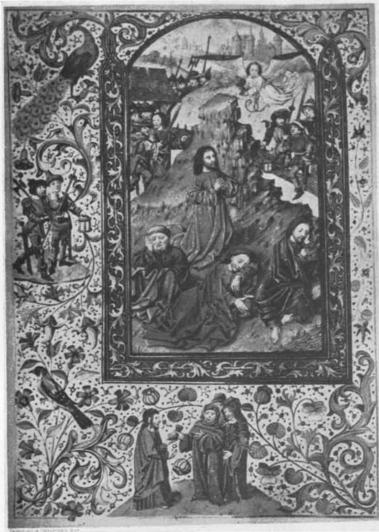
FIG. 8. BRÉVIAIRE DE CHARLES LE TÉMÉRAIRE. FOL. 56.

a former par leurs sommets éclairés des combinaisons géométriques. Ailleurs, au folio 43 (Crucifixion), le sacrifice d'Abraham traité en ronde bosse et posé sur une console, en retraite des architectures 3) , a la valeur démonstrative d'une sculpture et confirme les observations précédentes.