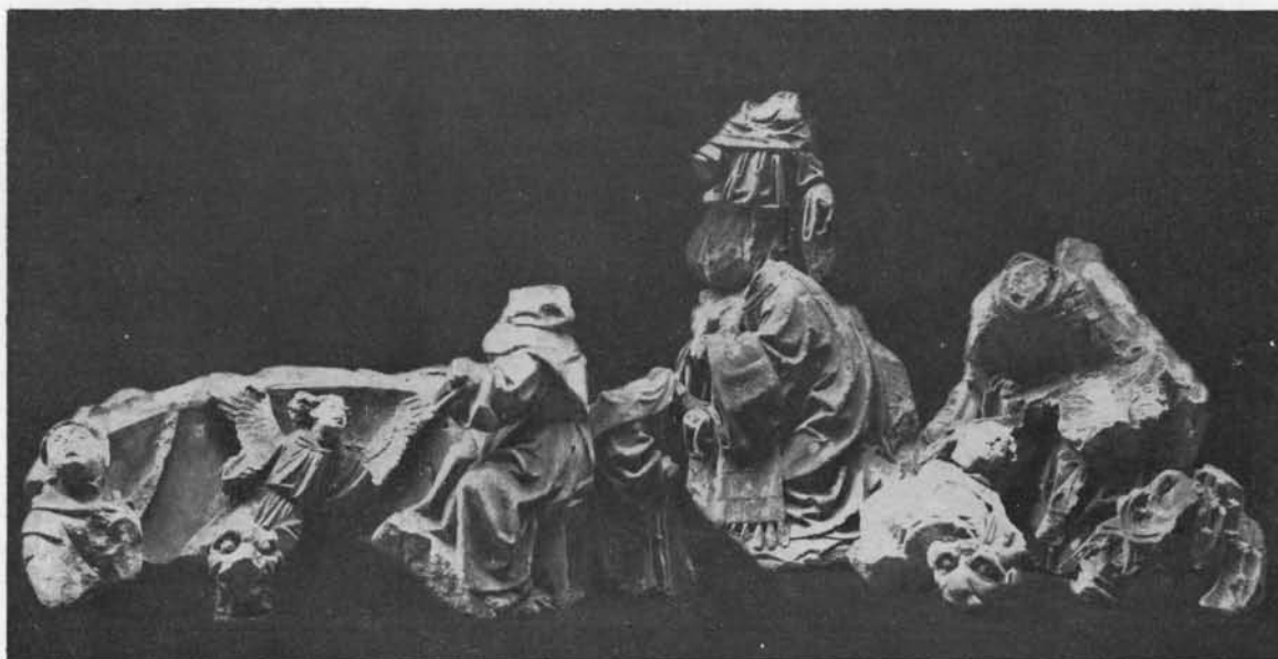
FIG. 2. B. FRAGMENTS DU RETABLE DE TOURCOING.

ralement disparu, nombre de fragments permettent d'apprécier les qualités des attitudes, du mouvement et le travail de la draperie. Tout compte fait, il est possible de reconnaître le sujet que le sculpteur avait traité et de caractériser son style. Ce sera l'objet de ce travail.