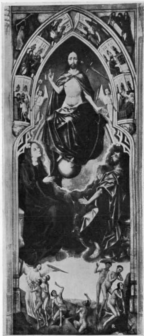
FIG. 11. JUGEMENT DERNIER. MUSÉE DE PRADO.

Parmi les oeuvres attribuées longtemps à Roger van der Weyden, mais non sans réserves 2) , nulle n'est plus connue qu'un panneau du Musée du Prado représentant le Jugement dernier (fig. 11). C'était, croyait-on, un volet du tableau d'autel livré par Roger en 1459 à l'abbé de St.-Aubert, à Cambrai. On est convaincu aujourd'hui de l'erreur ainsi commise. M. Hulin de Loo y voit l'oeuvre d'un des principaux successeurs de Roger à Bruxelles: le peintre Van der Stokt 3) , dont l'activité déborde largement le début du XVI e siècle. Or qu'y trouvons-nous? Très exactement