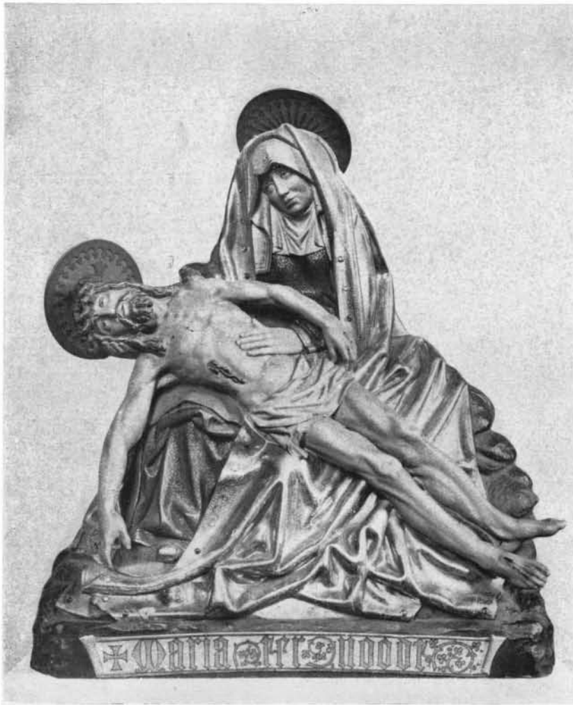
FIG. 6. PIETA DE MERCHTEM (BRABANT).

pect de quelque routine. Les deux monuments ne sont pas nécessairement très distants l'un de l'autre pour la date, mais ils se rattachent à des inspirations différentes.