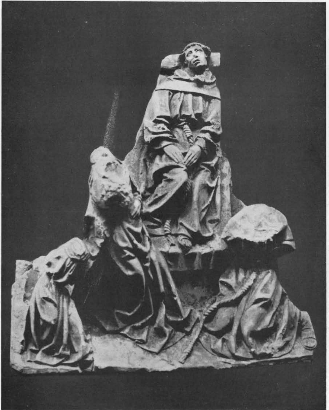
Fig. 3. SAINT ANTOINE DE PADOUE EN EXTASE ET AUTRES DÉTAILS.