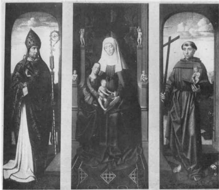
FIG. 9. „ANNASELBDRITT“.

Faisons un pas de plus et considérons les miniatures ganto-brugeoises contemporaines de Gérard David, également étudiées par Winkler 1) : la similitude entre les draperies et celles de nos sculptures devient de plus en plus frappante. Je cite entre autres les Heures de Cassel, par le maître de l' Hortulus animae (Winkler, pl. 67) et, de peu antérieur, le Bréviaire d'Isabelle d'Espagne, au British Museum