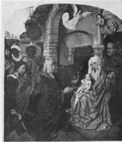
FIG. 7. BRÉVIAIRE DE CHARLES LE TÊMÉRAIRE. FOL. 35.

de sa vie et, comme l'oeuvre de Hambourg, remonte, quels qu'aient été les intermédiaires, à un prototype de Roger: j'en trouve la preuve dans le Christ étendu, sa rigidité, sa maigreur, son ossature, ses muscles apparents; d'autre part elle montre les plis durement stylisés des sculptures de Tourcoing, et cela d'une façon si frappante qu'on peut admettre pour l'oeuvre de bois et l'oeuvre de pierre à peu près la même date. Si donc nous pouvons déterminer les origines de cette draperie particulière et suivre son développement, nous aurons toutes chances de fixer approximativement l'origine et la date de nos monuments. Il suffira de s'appuyer sur des exemples assez nombreux et assez significatifs, sur des oeuvres intimement associées à l'évolution collective du goût et non des oeuvres de caractère exceptionnel, comme semble l'être la Pietà de Hambourg.