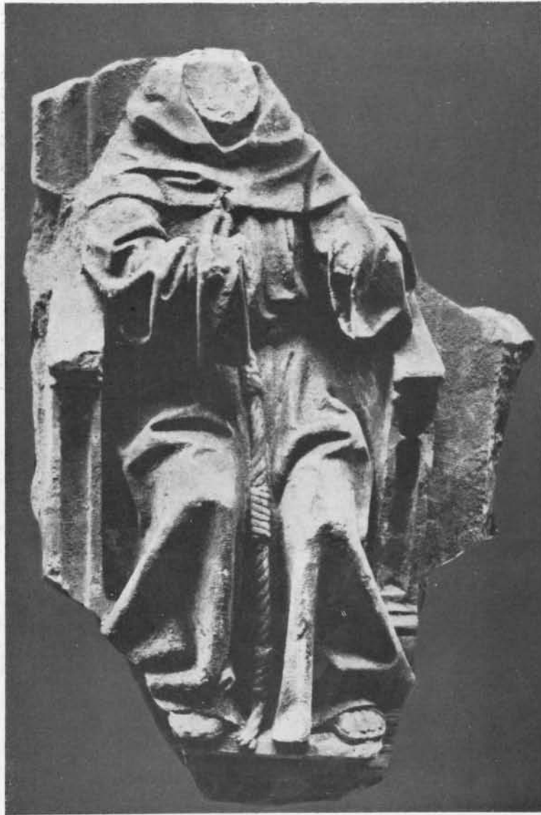
FIG. 4. ST. ANTOINE DANS LE MIRACLE DE L'ÂNE.

noyés dans des eaux incertaines mystérieusement troublées par l'amour, l'humilité et la reconnaissance. Voilà bien, je crois, une dramatique transformation de l'être et l'une des images les plus saisissantes, les plus vraies qui soient, des ravissements de l'âme dans la contemplation mystique.