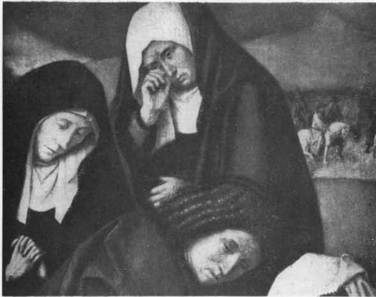
FIG. 10. GÉRARD DAVID. CRUCIFIXION (FRAGMENT).