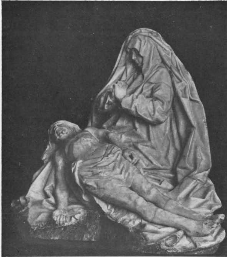
FIG. 5. PIETA DE LA COLLECTION KOERBER À HAMBOURG.

conformément aux attitudes, mais se soumet en même temps à une stylisation rigoureuse. Elle a des remous, mais des remous figés, durcis, qui produisent ici des cavités en façon de godets, là des talus rigides, formant des arêtes irrégulières. Composée savamment, elle manque de souplesse, d'abandon. Bien plus, on observera, en regardant d'un peu près, qu'elle obéit à une sorte de maniérisme systématique. Les plis en effet sont modelés soit en crêtes menues qui suivent des directions parallèles, comme on peut le voir sur le buste du saint en extase, soit en crêtes élevées déterminant des creux profonds et formant des figures