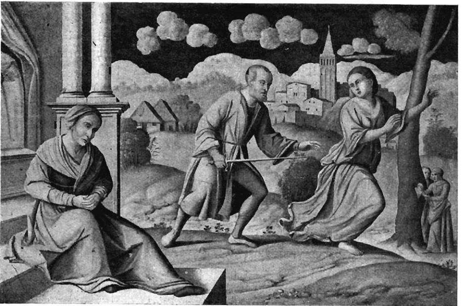
FIG. 4. — Naissance d'Adonis, par Mocetto. Musée Jacquemart-André, n° 1011.

Giorgione , Naissance d'Adonis, Vénus et Adonis, deuil de Myrrha, cassone à Padoue (Justi, II, n. 44); de son école, Vénus et Adonis, à la Nat. Gall., n. 1123.