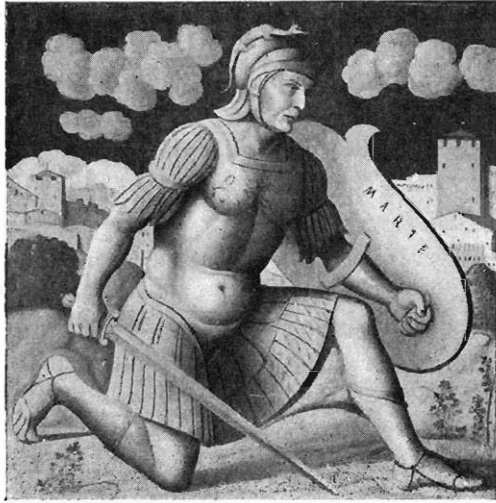
FIG. 3. — Mars, par Mocetto. Musée Jacquemart-André, n° 1015.

(Cr. H., III, p. 230); par Perino del Vaga et Pinturricchio dans l'appartement Borgia (Anderson, n. 2441, 5076); par P. Véronèse à la villa Maser. Un tableau de l'école de Brescia vers 1540, au Musée de Berlin, n. 176, représente Mars et la Paix, qui brûle des armes et des drapeaux sous les yeux du dieu. — Primatice a peint Mars et Belloue à Fontainebleau (Dimier, p. 286, 287, 296).