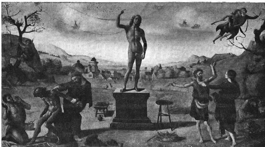
FIG. 5. — Histoire de Dédale, par Piero di Cosimo. Collection Kaufmann, à Berlin.

Piero di Cosimo , Dédale et Icare, dans la coll. Kaufmann à Berlin ( Rép. peint. , III, p. 758 ; ici fig. 5, avec détails obscurs).