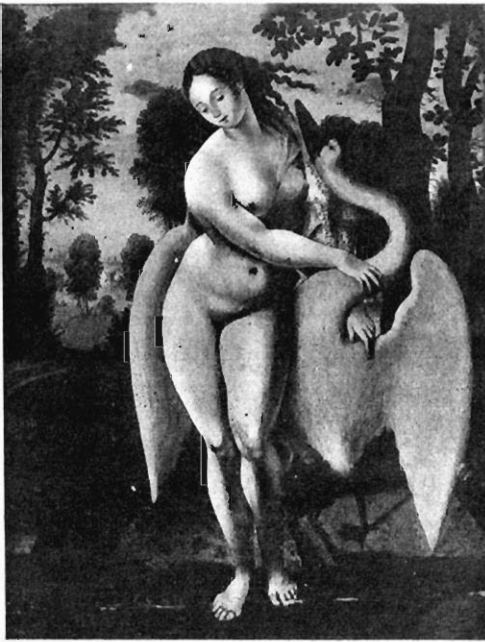
FIG. 2. — Léda et le cygne, par un imitateur de Léonard. Vente du 30 mai 1908 (Paris), n° 6.

Léonard de Vinci est l'auteur de deux croquis, représentant l'un