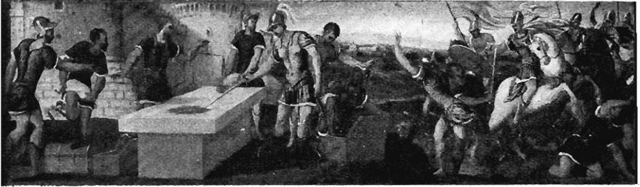
FIG. 8. — Histoire de Brennus, par Giolffino. Collection de feu Harry Hertz, à Rome.

Bonifazio , Brennus jetant son épée dans la balance, à Rome, dans la coll. Hertz (fig. 8).