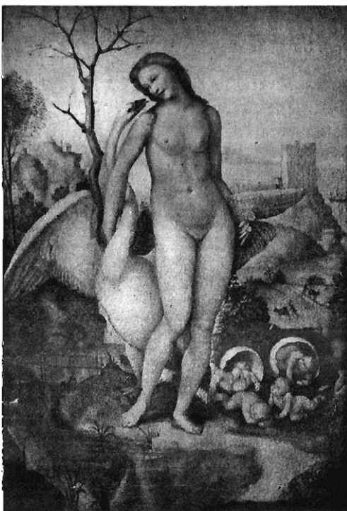
FIG. 1. — Léda et le cygne, par Sodoma. Ancienne collection Somzée, n° 385.

Titien (école de), à la Nat. Gall., n. 32.