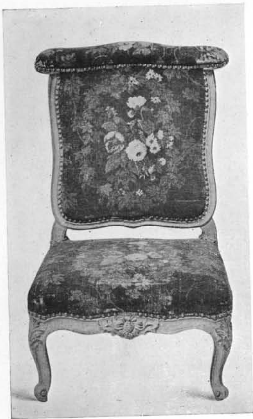
N o 37.