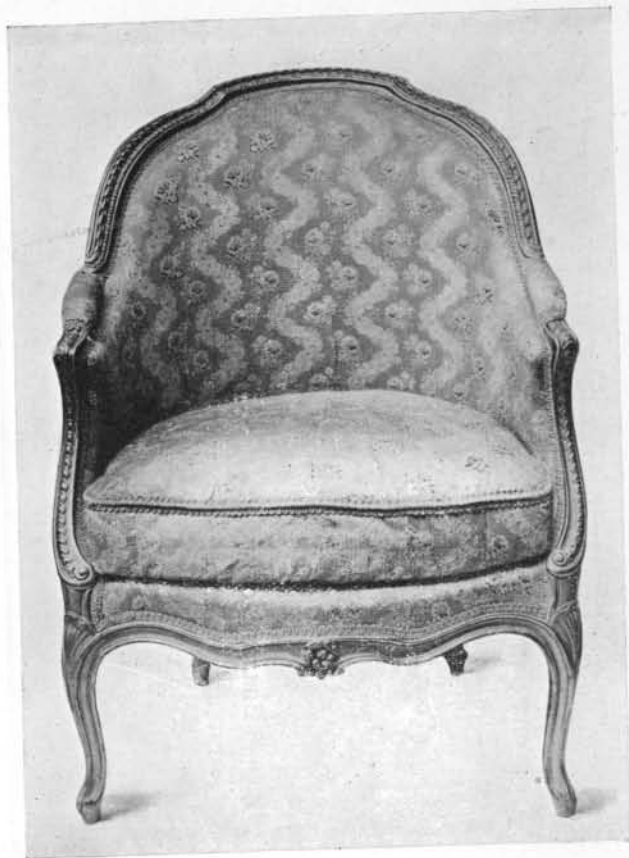
N o 42.