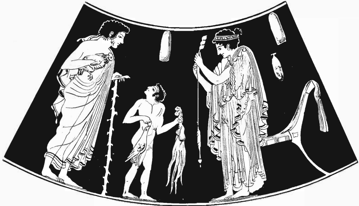
Ergänzte Zeichnung des Vasenbildes auf Tafel I (vgl. S. 6).