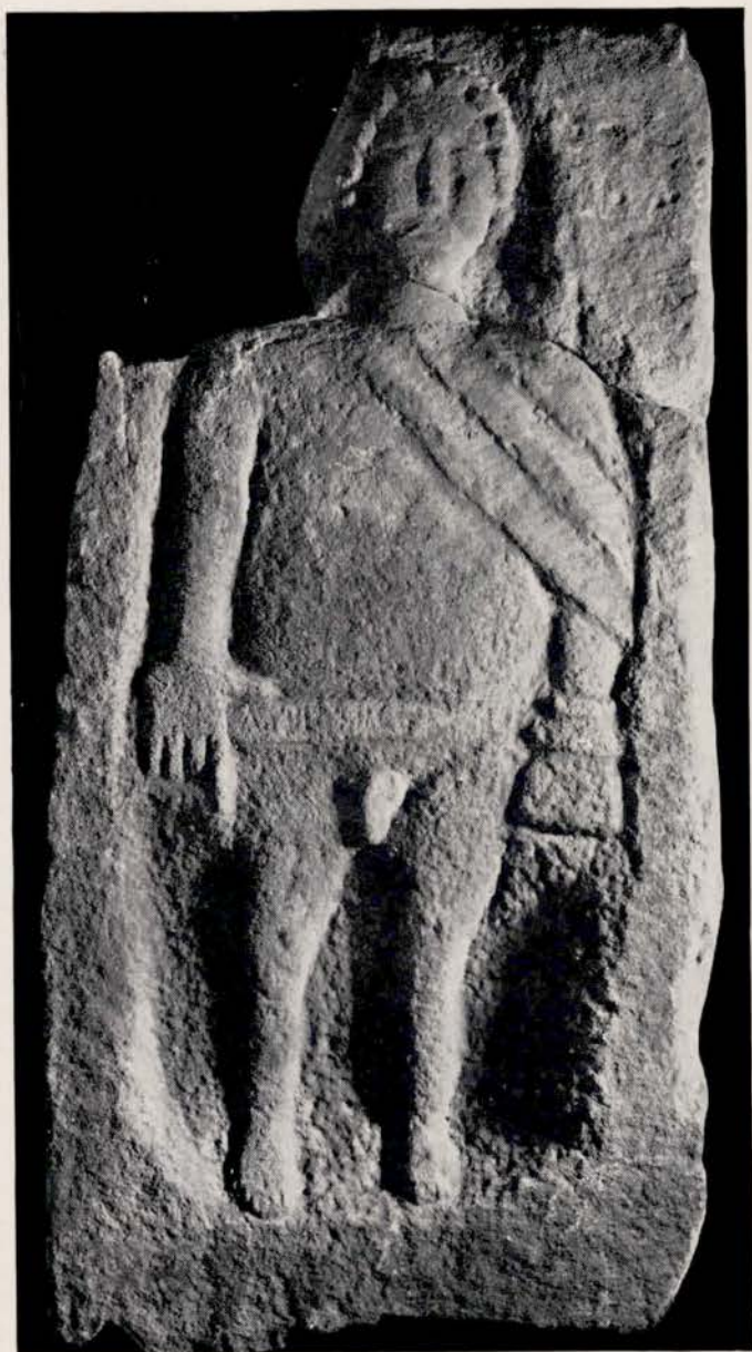
Fig. 8. — Mercure-Teutatès du Donon. Sur l'épée, signature gravée du sculpteur, ASBLVS F11C.