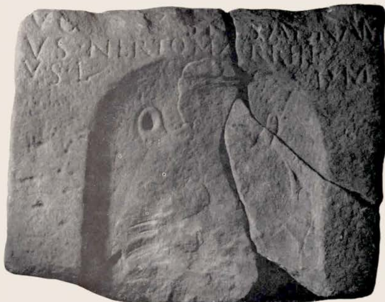
Fig. 9. — Stèle à Vosagus de Zinswiller.

11). Ainsi donc, notre dieu chasseur Vosegus Silvestris portait sur son bras un jeune sanglier recueilli vivant dans la forêt. Nous pensons qu'il s'agit là d'un mythe régional. Vosegus Silvestris aurait pris sous sa protection le jeune Teutatès , alors que ce dernier, sous la forme d'un jeune marcassin, se promenait sans défense dans la forêt. Nous aurions ici un mythe de protection, de tutelle et de défense, parallèle à celui de Teutatès et d' Esus (51).