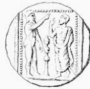
2 A 3. — MONNAIES DE TARSE.

d'un grand bûcher ; et les monnaies encadrent ordinairement l'image du dieu monté sur la chimère, dans une pyramide, que l'on a prise, à tort ou à raison, pour ce bûcher sacré. On sait aussi que l'un des principaux prêtres de Tarse, et sans doute le principal, qui portait le titre de stéphanéphore et qui se trouvait investi d'une autorité pouvant dégénérer en tyrannie politique, était le prêtre d'Hercule. Enfin ce dieu, comme l'Hercule Ἀρχηγέτης de Tyr, le Melkarth Baal-Tsour, était réputé le maître, ἀρχηγός, de la cité.