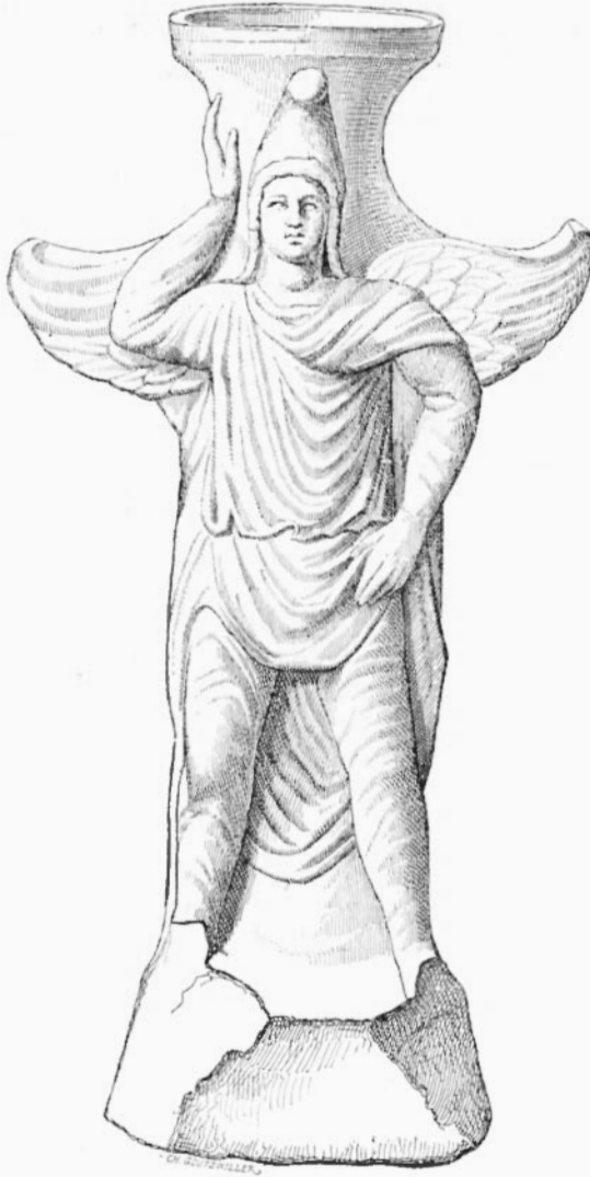
12. — MEN-ATYS, servant de brûle-parfums.

ronnes, qui donnent aux figures une noblesse un peu théâtrale. En résumé les ateliers de modelage de Tarse relèvent de la florissante