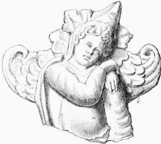
13. — MEN-ATYS,

Le dieu préféré est ici Bacchus, représenté comme dieu adulte et plus souvent encore comme dieu enfant 4 . Son culte envahit tous les autres. On voit surtout des insignes de son thiasé, la couronne de lierre ou de