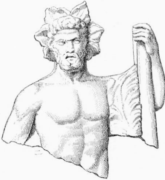
II. — HERCULE DE TARSE, bacchique et solaire.

On remarque aussi que les modèles étaient très-habilement disposés