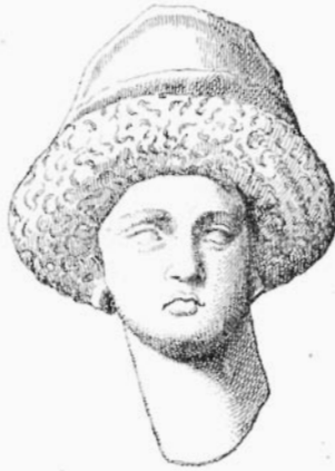
11. — COIFFURE ROMAINE. du temps de Trajan.

Un autre groupe nombreux est celui des jeunes dieux en costume phrygien, comme Mên ou Atys, que nous voyons également, parés du