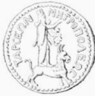
1. — MONNAIE DE TARSE.

et ceux que l'on trouve, en plusieurs endroits, sculptés sur les rochers, depuis le fond de l'Assyrie jusqu'à la Cappadoce. Le dieu de Tarse porte d'une main la hache à deux tranchants, avec une couronne rayonnante, et tient l'autre bras levé au-dessus de sa tête, geste significatif, que l'on retrouve chez l'Hercule égypto-phénicien d'Erythres, chez l'Adad solaire d'Héliopolis, et que l'on peut faire remonter, par une filiation historique bien établie, jusqu'à l'Ammon-Générateur des Égyptiens 1 . Quel que soit le rapport de ce geste avec celui du Sardanapale de la légende, c'est au