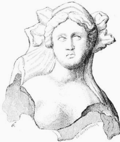
S. — ARIADNE-APHRODITE DE TARSE.