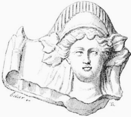
9. — ARIADNE-APHRODITE,

En face de ces opinions contradictoires, le mieux est de s'adresser aux monuments mêmes et de voir s'ils n'ont pas aussi quelque réponse à donner. Remarquons d'abord que toutes les terres cuites de Tarse ont été retrouvées à l'état de fragments ; parmi les nombreuses pièces données au Louvre, il n'y a qu'un très-petit nombre d'objets qui soient à peu près intacts. Elles devaient même être déjà brisées, avant d'avoir été déposées à la place où la pioche les retrouve aujourd'hui ; autrement on en aurait un plus grand nombre de morceaux dont les cassures se