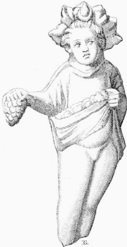
10. — BACCHUS ENFANT, avec les attributs d'Horus.

de placer les figures dans le four; mais il serait étonnant qu'une distraction aussi grossière se fût reproduite un aussi grand nombre de fois. Voici l'explication que je proposerais. Il pouvait arriver parfois que la terre des figurines fût déjà sèche au moment de l'assemblage, ou que la barbotine employée pour la soudure fût trop claire; au premier feu,