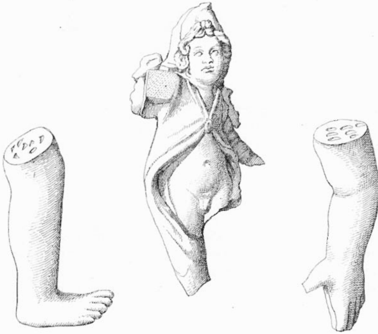
I A G. — PIÈCES DÉCOLLÉES A LA CUISSON.

portent souvent comme surfrappe l'image d'une vache, avec le nom d'Io en lettres grecques. C'est aussi après la conquête d'Alexandre que la même ville émet une belle et rare monnaie d'argent, à légende hellénique, portant d'un côté la tête d'une Héra diadémée, et de l'autre Hercule étouffant le lion. La numismatique et la mythologie de l'ancienne Tarse présentent toute une série de faits archéologiques d'un grand intérêt