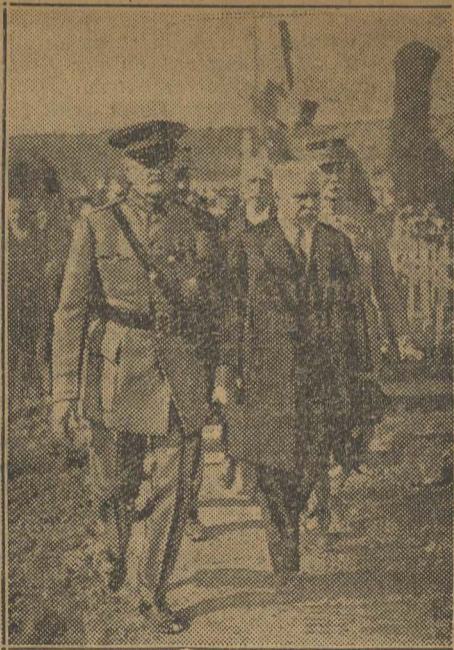
Le général Pershing et M. Poincaré visitent les tombes américaines.